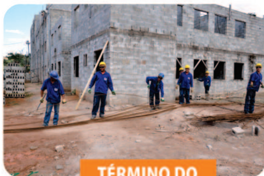
TÉRMINO DO MORADA VIVA