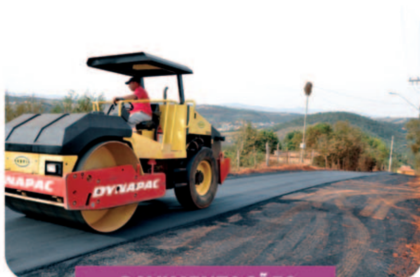
PAVIMENTAÇÕES EM DIVERSOS BAIRROS