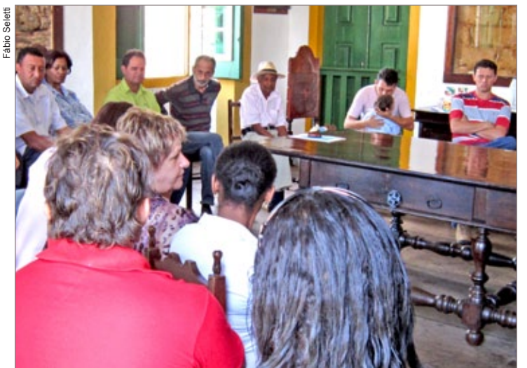
Reunião do “grupão” no dia 3 de junho