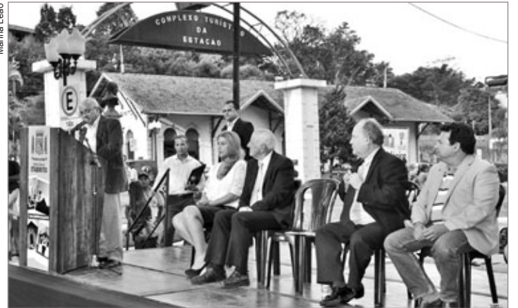
Autoridades fazem o desenlace da fita das novas instalações da pasta

destaque em todo o estado de Minas Gerais, sendo a 3ª em todo o estado na contratação de mão de obra com carteira de trabalho assinada. Isso mostra que os empregos criados aqui são de