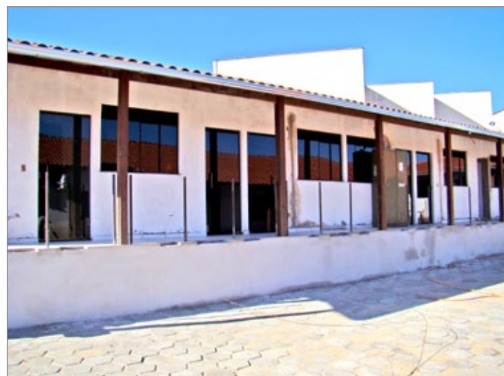
Reforma e ampliação da delegacia permitirá expandir os serviços prestados à população