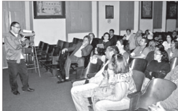
Durante o encontro, moradores das áreas de risco buscaram informações e orientações preventivas

Prevenção de tragédias ainda esbarra na falta de apoio do município