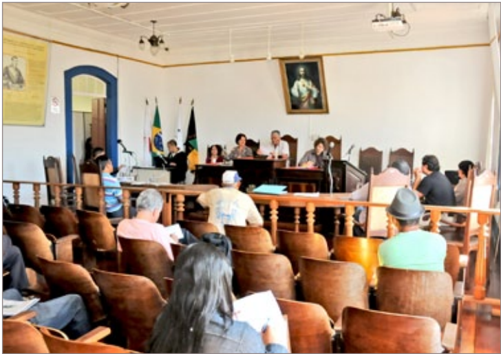
Durante a reunião de quinta-feira, 31, várias proposições foram aprovadas pelos vereadores de Ouro Preto em prol do município