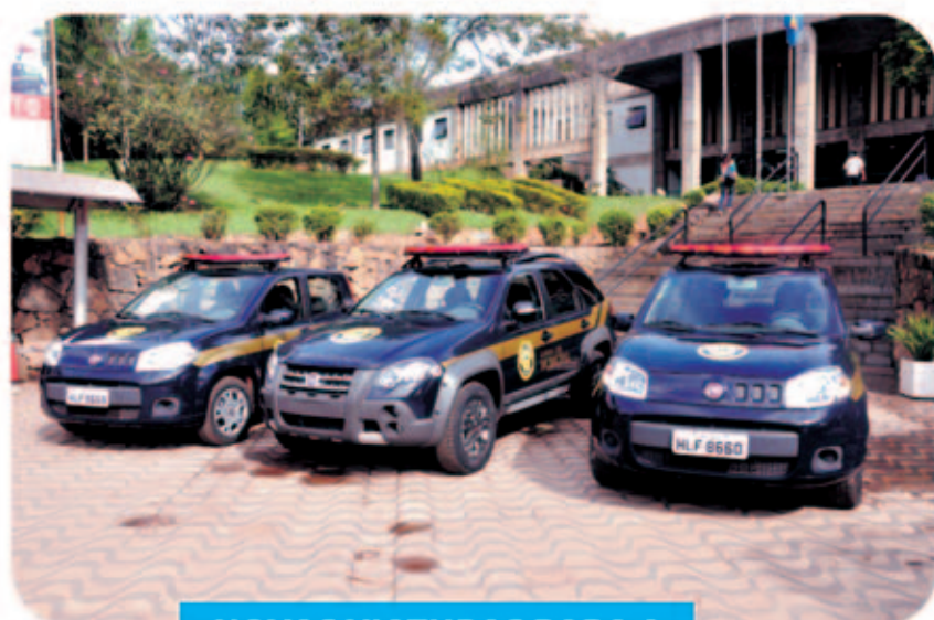
NOVAS VIATURAS PARA A GUARDA CIVIL MUNICIPAL

Confira outros projetos em: www.itabirito.mg.gov.br