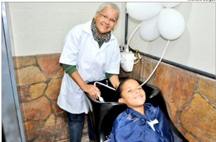
Salão de beleza foi montado na escola para orientar os alunos