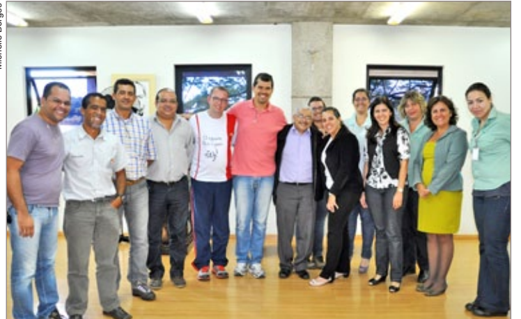
Equipe da ESPN reuniu-se com as autoridades de Itabirito para acertar os últimos detalhes do evento