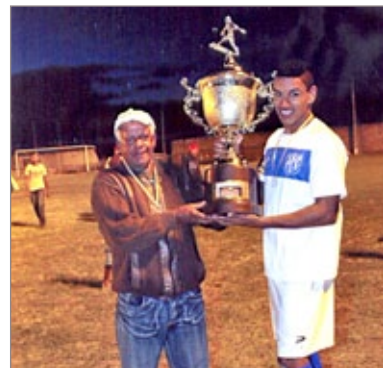
Capitão do Cruzeiro do Sul recebe troféu como campeão do Cachoeirão