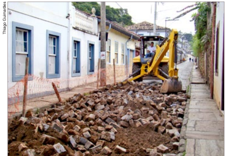
Obras na rua Tomé Afonso

A previsão de duração da interdição é de 60 dias. Durante este período, o trânsito para veículos e transporte coletivo será feito em mão dupla na rua Alvarenga, entre a Ponte do Rosário e a Escola Municipal Alfredo Baeta, no bairro Cabeças. O fluxo de trânsito segue normal na rua Irmãos Kennedy até a Tomé Afonso. A obra é uma realização do Orçamento Participativo, em parceria com o Semae.