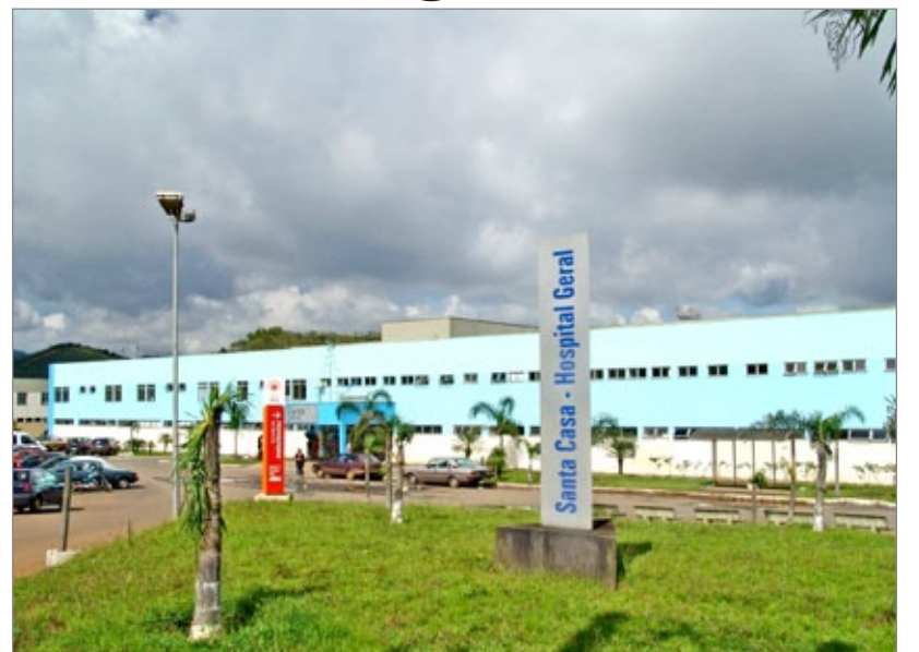
Santa Casa de Misericórdia de Ouro Preto

De acordo com o SUS, Ouro Preto tem a preferência para receber os equipamentos por ser a sede da microrregião, porém não há obrigatoriedade para que a aparelhagem fique no Município-Sede. Sendo assim, as três Secretarias entraram em acordo para distribuir os equipamentos entre as cidades.