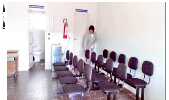
Novas cadeiras foram instaladas para possibilitar atendimento mais confortável