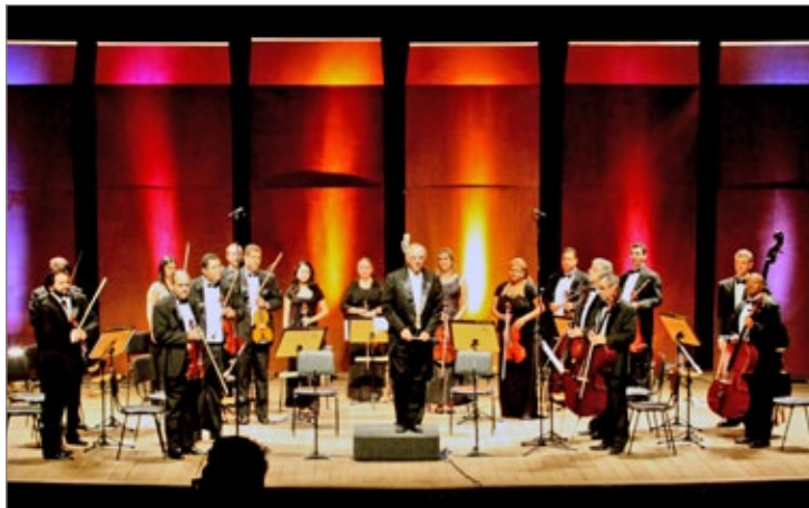
Orquestra de Câmara do Sesiminas