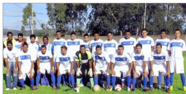
Time do Cruzeiro do Sul

A grande final foi realizada no dia 22 de maio, no campo do Cruzeiro do Sul. Em jogo apertado, o Santa Luzia e Cruzeiro de Sul empataram por 2x2 no tempo normal. Na decisão nos pênaltis, o Cruzeiro de Sul conquistou vitória por 4x1.