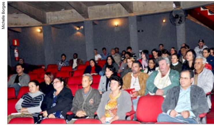
Trabalho em equipe garante sucesso da 22ª Julifest

Dia 12/07 - Victor e Leo; Dia 13/07 - João Neto e Frederico; Dia 14/07 - Jota Quest; Dia 15/07 - Teodoro e Sampaio.