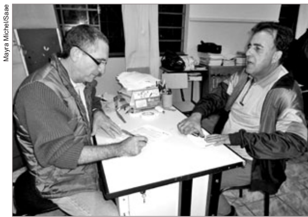
Interessados em receber o benefício se cadastraram durante a reunião