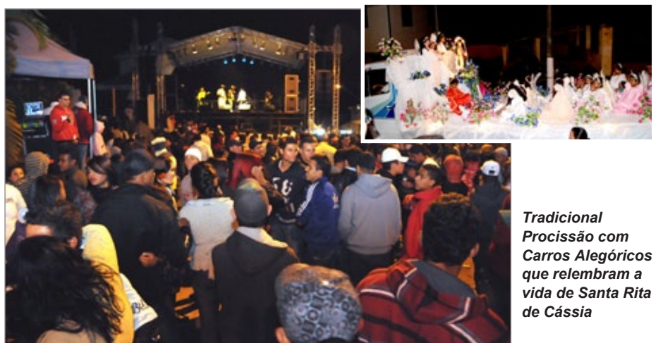
Tradicional Procissão com Carros Alegóricos que relembram a vida de Santa Rita de Cássia