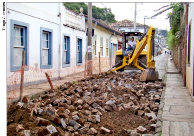
Obras na rua Tomé Afonso

A previsão de duração da interdição é de 60 dias. Durante este período, o trânsito para veículos e transporte coletivo será feito em mão dupla na rua Alvarenga, entre a Ponte do Rosário e a Escola Municipal Alfredo Baeta, no bairro Cabeças. O fluxo de trânsito segue normal na rua Irmãos Kennedy até a Tomé Afonso. A obra é uma realização do Orçamento Participativo, em parceria com o Semae.