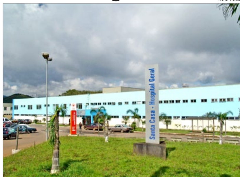
Santa Casa de Misericórdia de Ouro Preto

De acordo com o SUS, Ouro Preto tem a preferência para receber os equipamentos por ser a sede da microrregião, porém não há obrigatoriedade para que a aparelhagem fique no Município-Sede. Sendo assim, as três Secretarias entraram em acordo para distribuir os equipamentos entre as cidades.