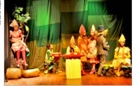
A Menina Fada Pop Star reuniu centenas de pessoas na Casa de Cultura

Já no dia 2 de junho, sábado, acontece a apresentação da peça “Sonho Dourado” (classificação: 12 anos), às 20h, na Casa de Cultura Maestro Dungas. No domingo, dia 3 de junho, os atores encenam “Os Saltimbancos”, às 16h, e “As Mãos Entrelaçadas” (classificação: 16 anos), às 20h, também na Casa de Cultura. Os ingressos estão à venda a preços populares, R$3,00, na sede do Atelier, localizada à Rua José Sans, nº 16, bairro Centro, telefone: (31) 3561-1384. Venha prestigiar e traga toda a família!