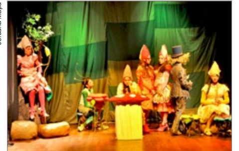
A Menina Fada Pop Star reuniu centenas de pessoas na Casa de Cultura

Já no dia 2 de junho, sábado, acontece a apresentação da peça “Sonho Dourado” (classificação: 12 anos), às 20h, na Casa de Cultura Maestro Dungas. No domingo, dia 3 de junho, os atores encenam “Os Saltimbancos”, às 16h, e “As Mãos Entrelaçadas” (classificação: 16 anos), às 20h, também na Casa de Cultura. Os ingressos estão à venda a preços populares, R$3,00, na sede do Atelier, localizada à Rua José Sans, nº 16, bairro Centro, telefone: (31) 3561-1384. Venha prestigiar e traga toda a família!