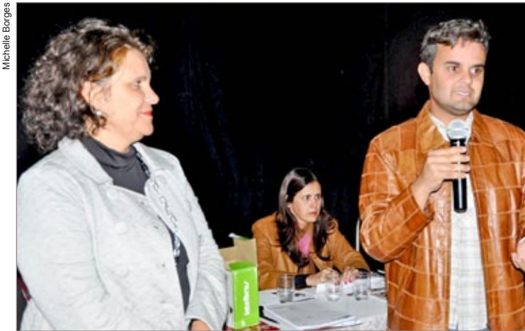
Representantes da Prefeitura esclareceram dúvidas dos presentes