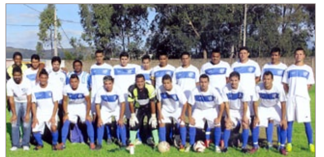
Time do Cruzeiro do Sul

A grande final foi realizada no dia 22 de maio, no campo do Cruzeiro do Sul. Em jogo apertado, o Santa Luzia e Cruzeiro de Sul empataram por 2x2 no tempo normal. Na decisão nos pênaltis, o Cruzeiro de Sul conquistou vitória por 4x1.