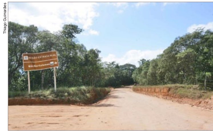
Trecho da estrada que liga Cachoeira do Campo a São Bartolomeu

As equipes da Prefeitura iniciaram, na última segunda-feira, 21, as obras de manutenção na região da