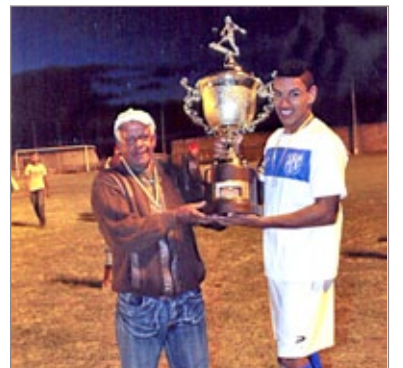
Capitão do Cruzeiro do Sul recebe troféu como campeão do Cachoeirão