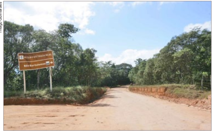
Trecho da estrada que liga Cachoeira do Campo a São Bartolomeu

As equipes da Prefeitura iniciaram, na última segunda-feira, 21, as obras de manutenção na região da