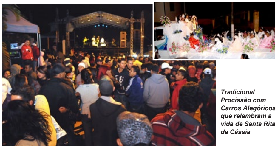
Tradicional Procissão com Carros Alegóricos que relembram a vida de Santa Rita de Cássia