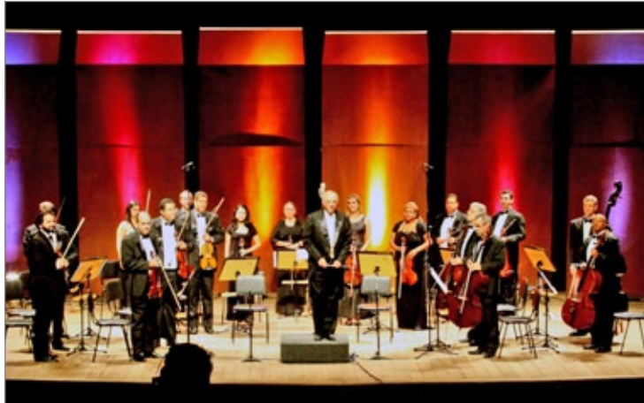
Orquestra de Câmara do Sesiminas