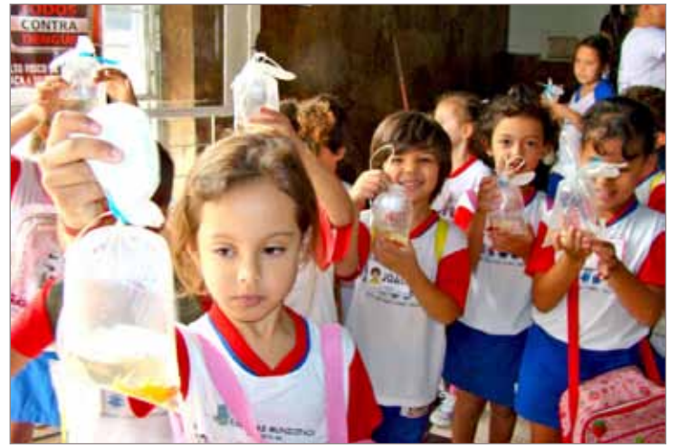
A cada ano, o SAAE prepara grandes surpresas para as crianças