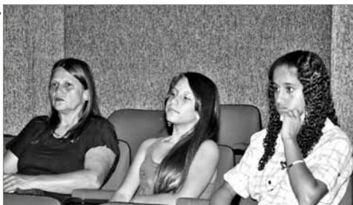
População participou atenta da apresentação sobre os benefícios da substituição das sacolas plásticas