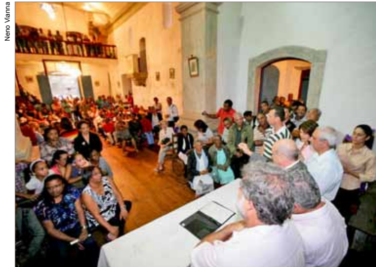
Comunidade de Lavras Novas durante cerimônia de assinatura da Ordem de Serviço da Estrada que liga Lavras Novas à Estrada Real