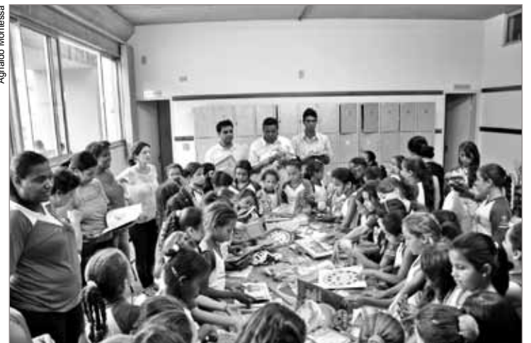
Alunos da Rede Municipal de Ensino de Itabirito comemoram a aquisição da Prefeitura