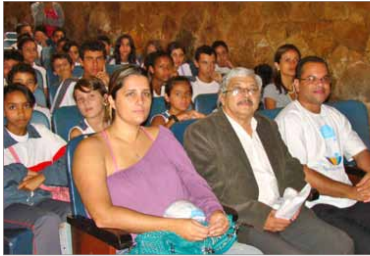
Autoridades de Itabirito participam das apresentações, que, em 2012, terá sessão especial aberta ao público