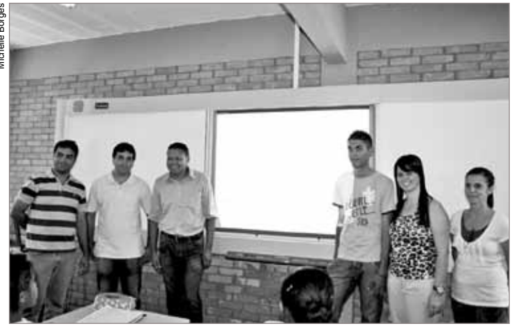
Equipe da Secretaria de Educação acompanhou de perto o funcionamento dos novos equipamentos