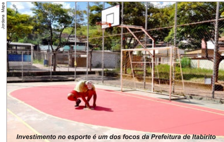
Investimento no esporte é um dos focos da Prefeitura de Itabirito