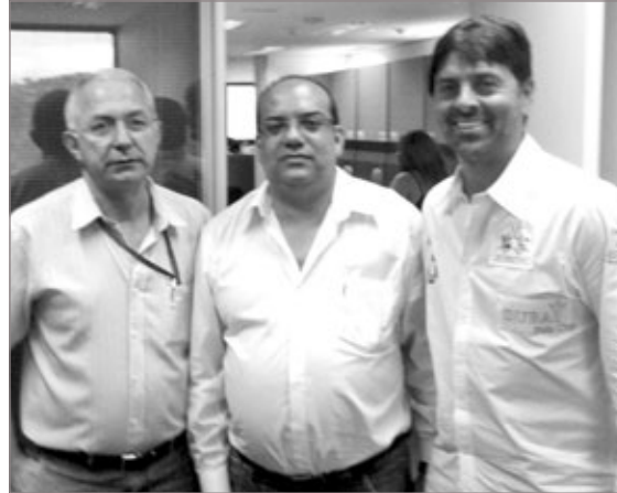
Secretário de Planejamento e Captação de Recursos de Itabirito (ao centro) reuniu-se com membros da Fundação Rural Minas

Os trabalhos de desassoreamento solicitados consistem na retirada de resíduos sólidos do leito do rio, alívio de pontos de estrangulamento e desobstrução das margens dos rios e córregos, que muitas vezes servem como depósitos de lixo e entulhos. Além do apoio da Fundação Rural Minas, a Prefeitura de Itabirito está em contato com diversos órgãos do Governo Estadual e Federal para as ações que evitem novas enchentes na cidade.