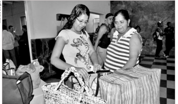
Público conferiu diversos modelos de sacolas retornáveis disponíveis no mercado

"A cidade está de parabéns, pois Itabirito é o primeiro município do interior de Minas Gerais a implantar o mesmo sistema que aderimos em Belo Horizonte. A lei de proibição das sacolas plásticas nos comércios está em tramitação na Assembleia Legislativa e, em breve, será lei no estado", explicou o superintendente da Associação Mineira de Supermerca-