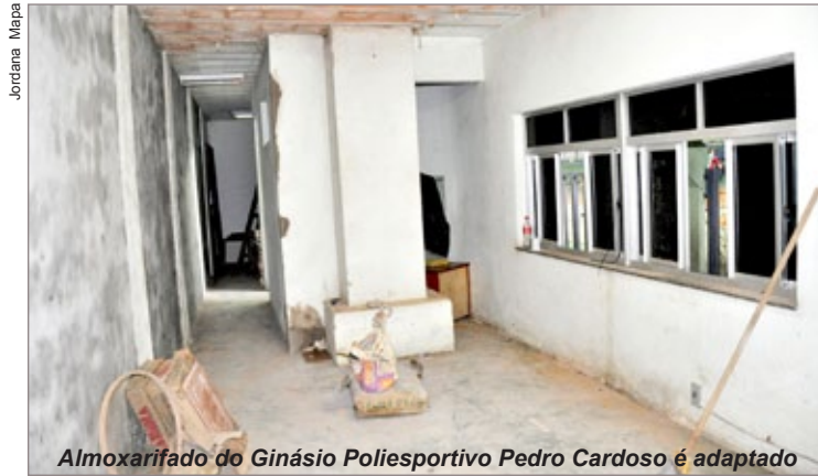
Almoxarifado do Ginásio Poliesportivo Pedro Cardoso é adaptado

No Ginásio Poliesportivo Pedro Cardoso, a Prefeitura está reformando o antigo almoxarifado, que será o novo espaço de trabalho da administração da quadra. “No local, estão sendo realizadas adequações necessárias para que os funcionários tenham conforto para executarem o seu trabalho, como colocação de janelas, pintura e restauração das mobílias para o novo escritório”, destaca o secretário.