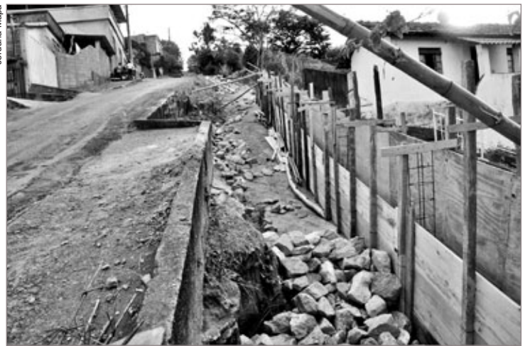
Ação na Rua Itabira do Campo oferece segurança aos moradores