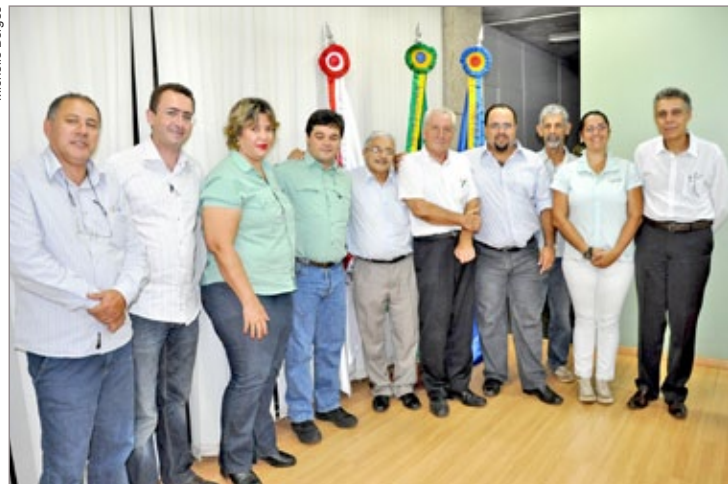
Assinatura do contrato reuniu autoridades de Itabirito e da Vale