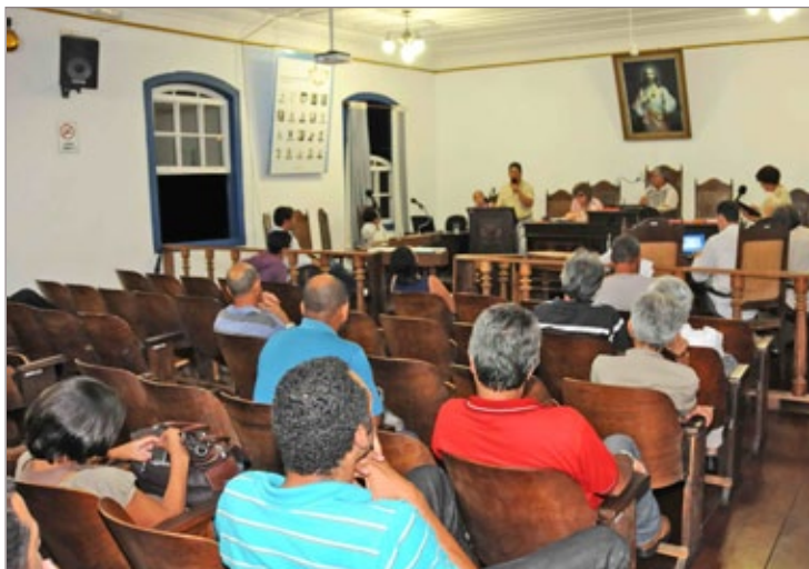
Câmara recebeu denúncia contra a PM durante Tribuna Livre