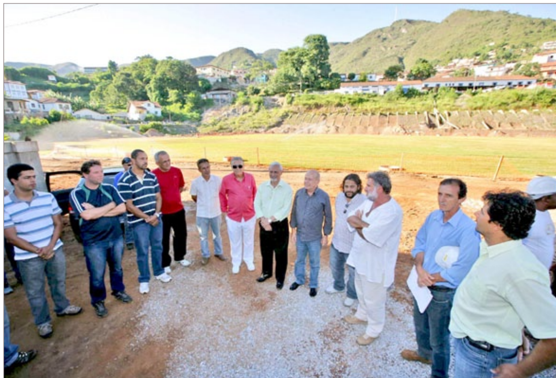
Prefeito Angelo Oswaldo e demais autoridades durante visita às obras do Complexo Esportivo Água Limpa