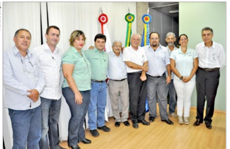
Assinatura do contrato reuniu autoridades de Itabirito e da Vale