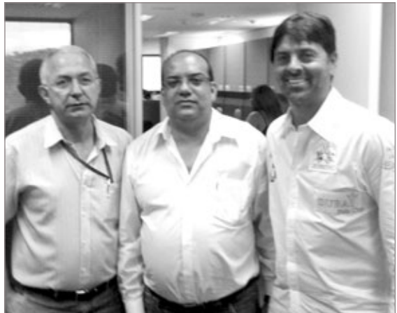
Secretário de Planejamento e Captação de Recursos de Itabirito (ao centro) reuniu-se com membros da Fundação Rural Minas

Os trabalhos de desassoreamento solicitados consistem na retirada de resíduos sólidos do leito do rio, alívio de pontos de estrangulamento e desobstrução das margens dos rios e córregos, que muitas vezes servem como depósitos de lixo e entulhos. Além do apoio da Fundação Rural Minas, a Prefeitura de Itabirito está em contato com diversos órgãos do Governo Estadual e Federal para as ações que evitem novas enchentes na cidade.