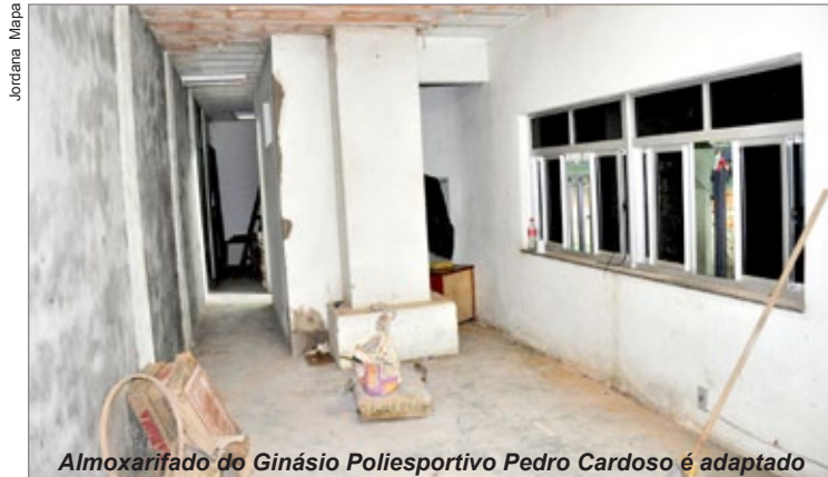
Almoxarifado do Ginásio Poliesportivo Pedro Cardoso é adaptado

No Ginásio Poliesportivo Pedro Cardoso, a Prefeitura está reformando o antigo almoxarifado, que será o novo espaço de trabalho da administração da quadra. “No local, estão sendo realizadas adequações necessárias para que os funcionários tenham conforto para executarem o seu trabalho, como colocação de janelas, pintura e restauração das mobílias para o novo escritório”, destaca o secretário.