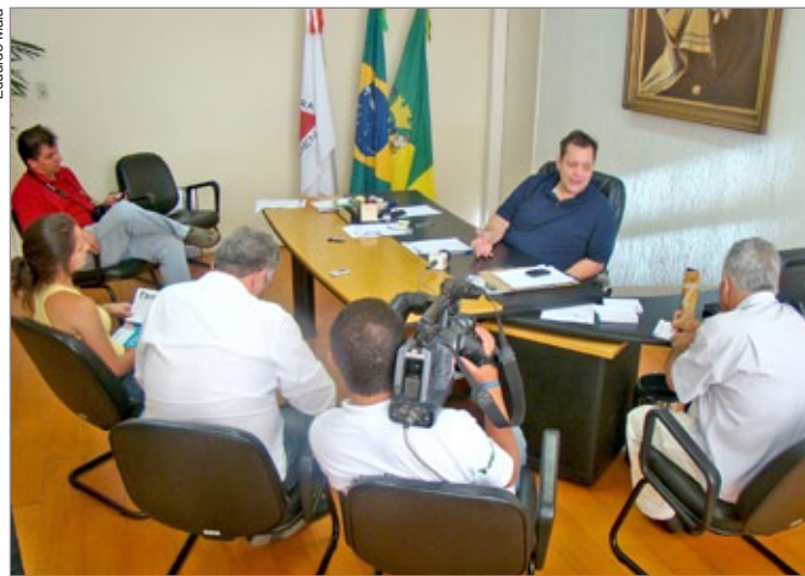
Prefeito Roberto Rodrigues afirma à imprensa que conclusão de obras na avenida é prioridade máxima. Nova administração pretende atacar outros problemas emergenciais da cidade

Sobre a obra na Avenida Nossa Senhora do Carmo, atualmente com 93% da primeira etapa concluída, o prefeito garante que o túnel estará finalizado até o final de abril. “Preocupamos essa morosidade, já que a obra estava prevista para ser concluída em seis meses. Isso é prioridade máxima para nós e até o final de abril ela estará concluída” diz o prefeito. Segundo Rodrigues, 40 famílias desabrigadas em decorrência das chuvas terão especial atenção. “Essas pessoas vivem uma situação complicada, pois