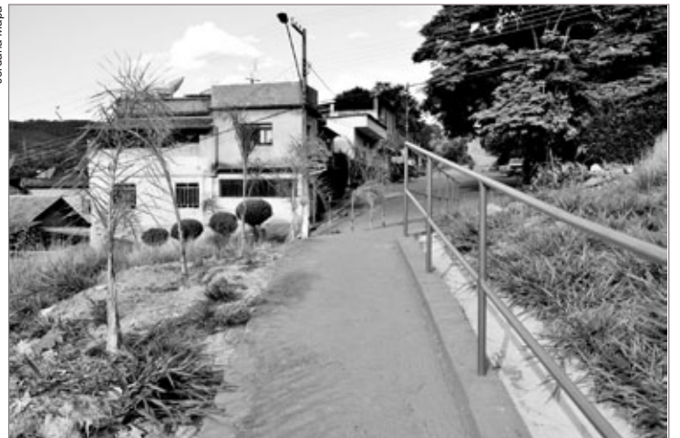
Obra melhora acesso dos moradores do bairro Nossa Senhora de Fátima