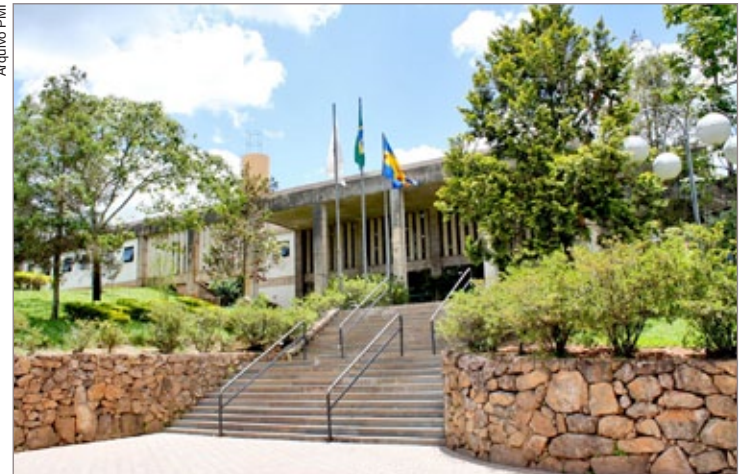
Prédio principal da Prefeitura receberá as ações de economia de energia

Serão desenvolvidos trabalhos com o acompanhamento do Instituto Brasileiro de Administração Municipal (IBAM), instituição com larga experiência no apoio aos municípios brasileiros e com conhecimento específico sobre a gestão eficiente da energia elétrica, além de coordenar a Rede Cidades Eficientes – ECE, em parceria com a Eletrobrás Procel.