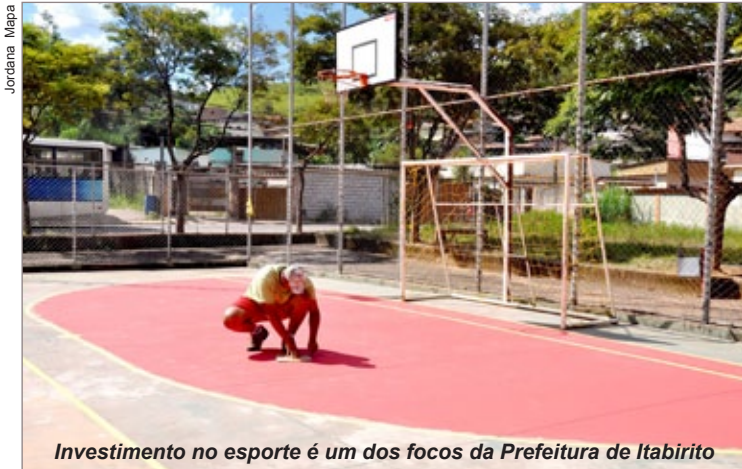
Investimento no esporte é um dos focos da Prefeitura de Itabirito