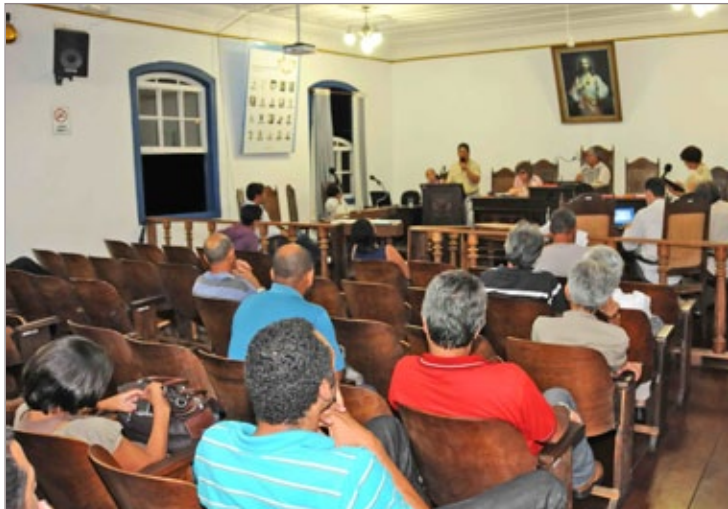
Câmara recebeu denúncia contra a PM durante Tribuna Livre