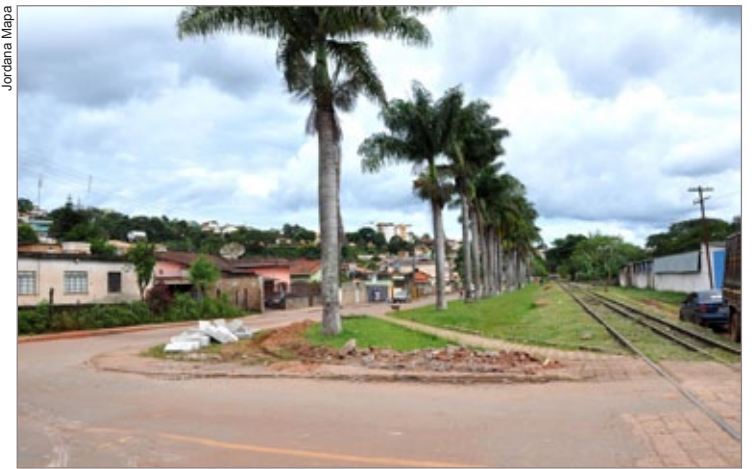
Alargamento está sendo feito no cruzamento entre as Ruas Belo Horizonte e Emídio Quites