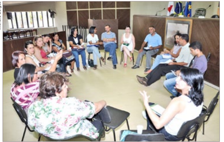
Diretores discutem melhorias trazidas pelo plano

O secretário explica ainda que o novo plano segue o piso nacional dos professores, que determina que 1/3 da carga horária do professor deverá ser reservada ao planejamento das aulas. Desta forma, a carga horária do professor da Educação Infantil e dos anos iniciais será de 30 horas. No entanto, a presença com os alunos totaliza 20 horas, ou seja, 2/3 da carga horária total. Para os professores das séries finais, do 6º a 9º ano, do Ensino Fundamental, a carga horária total é de 27 horas/aula, sendo 18 horas/aula traba-