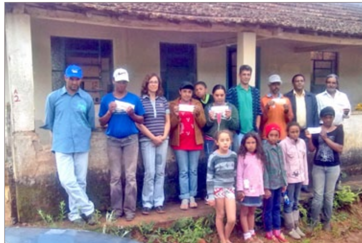
Famílias de Santa Rita recebem pagamento pelo mel