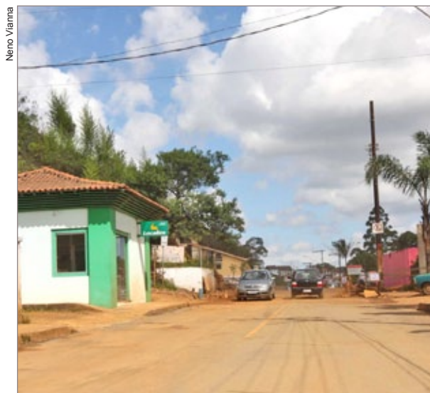
Trânsito na rua Padre Rolim liberado após trabalhos ágeis e eficientes da Prefeitura com o apoio de empresas e empreiteiras da região

O prefeito Angelo Oswaldo disse que, nesta segunda-feira (23), tem início o levantamento de cada um dos imóveis construídos no bairro São Francisco de Paula. "Com base no diagnóstico dos geólogos da UFOP e engenheiros da PMOP, vamos consolidar o bairro e proteger as casas que se acham em situação estável e segura", explicou. Na rua 13 de Maio, prosseguem em ritmo intenso os trabalhos de remoção do deslizamento, com vistas à proteção da encosta e reabertura da via por onde passavam diariamente centenas de pessoas. "Os geólogos autorizaram a intervenção e a obra vai ser rápida", garantiu o prefeito.