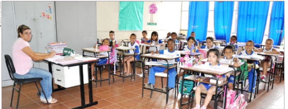
Profissionais do magistério comemoram abono no valor de 100% do vencimento

Valorizar os profissionais da educação, grandes responsáveis pelos altos índices de avaliação do ensino em Itabirito, é investir em educação de qualidade. Pensando dessa forma, a Prefeitura concedeu um abono pecuniário aos profissionais do magistério, em dezembro, no valor de 100% do vencimento. “Esta é a primeira vez que o abono é con-