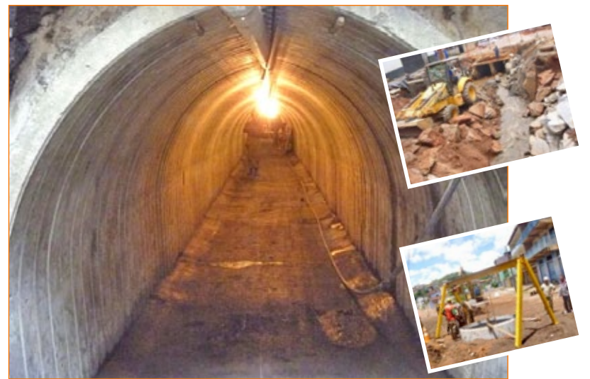
Visão geral da nova rede em Túnel Bala (bueiros de concreto tipo mini-túnel)

Os transtornos são constantes, mas a Prefeitura Municipal de Mariana, através da Secretaria de Obras e Serviços Públicos pede a compreensão dos moradores e em breve a Avenida terá seu fluxo normalizado.