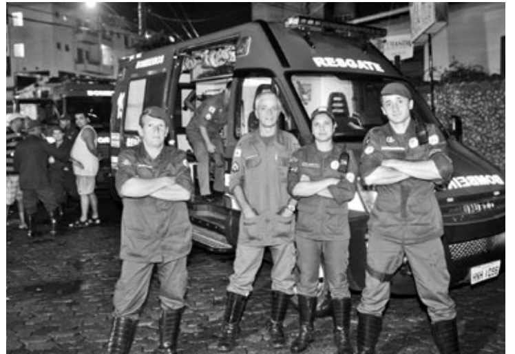
Corpo de Bombeiros Municipal orienta as pessoas sobre os cuidados e prevenções para curtir a festa

Um efetivo de 52 policiais militares trabalhará nos seis dias de Carnaval e mais 80 profissionais já foram solicitados para contribuir com o trabalho da