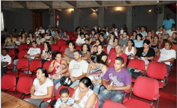
Mais de 90 pessoas concorreram às 23 vagas