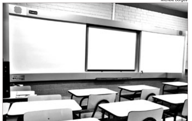
Lousas interativas estão sendo instaladas nas escolas de Itabirito