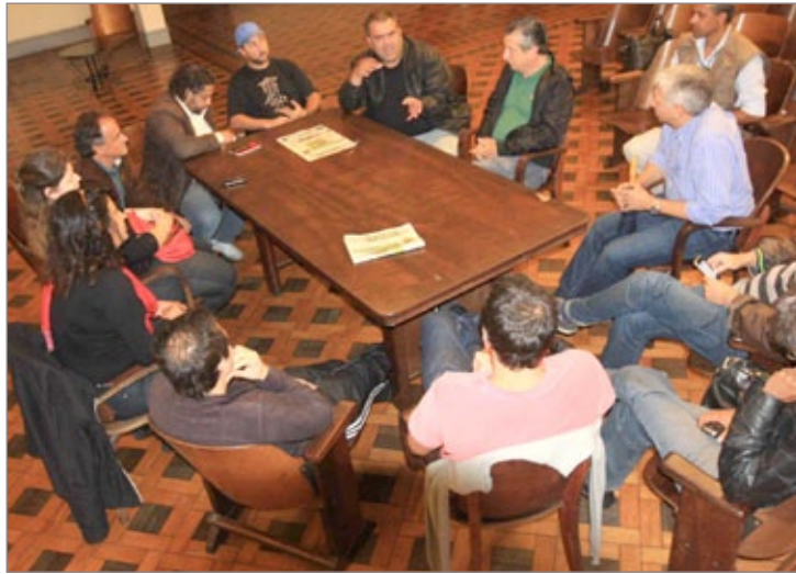
Reunião na Prefeitura com empresários do setor turístico de Ouro Preto