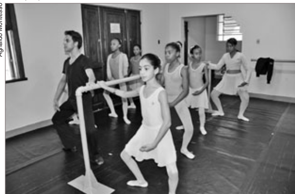
Alunos que já participam das aulas e pretendem continuar em 2012 devem se inscrever até o dia 11 de janeiro

Os interessados em participar das aulas de ballet devem comparecer a Secretaria de Patrimônio Cultural e Turismo, localizada no Prédio da Caixa Econômica, à Avenida Queiroz Júnior, nº 620, Centro, no 2º andar, portando comprovante de endereço, cópias da Certidão de Nascimento da criança e do documento de Identidade do responsável pelo aluno. O horário de funcionamento é das 9h às 12h e das 13h às 17h. As aulas começam dia 1º de fevereiro. Outras informações pelo telefone: (31) 3563-2924.