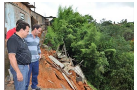
Deputado visita casas atingidas pelas voçorocas em Cachoeira do Campo