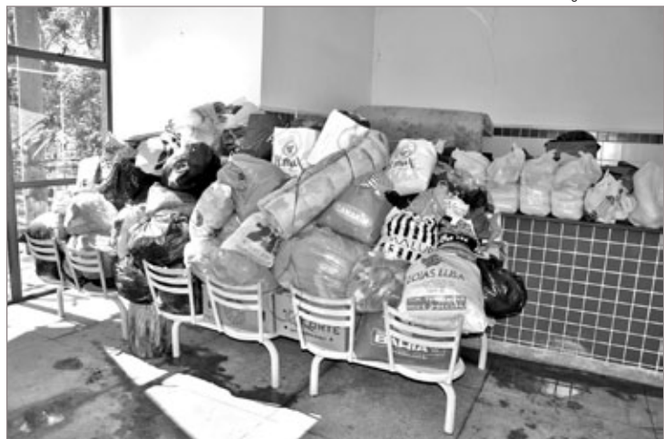
População de Itabirito ajudou famílias atingidas pelas enchentes entregando doativos