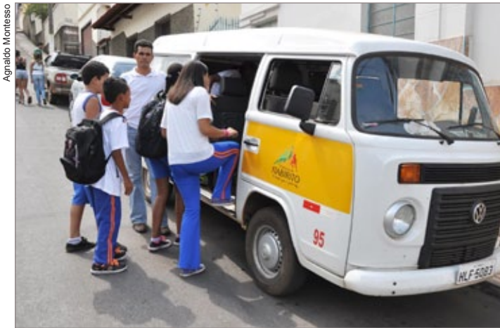
Passageiro estudantil gratuito atende alunos das redes municipal e estadual de Itabirito