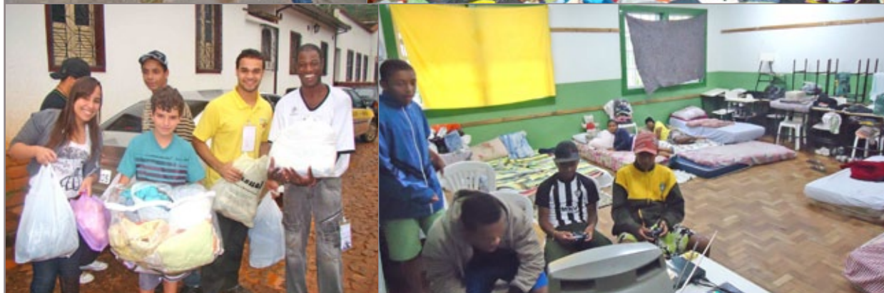
Solidariedade e voluntariado em prol das vítimas das chuvas