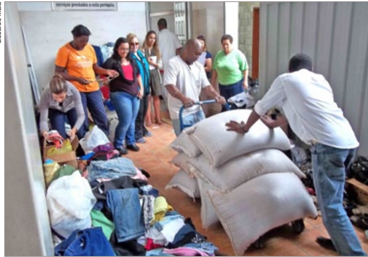
Na Paróquia de São Sebastião, um dos abrigos e pontos de arrecadação, voluntários trabalham diuturnamente para ajudar as vítimas das enchentes