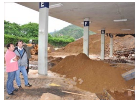
Trabalhos de recuperação continuam intensos na Rodoviária de Ouro Preto