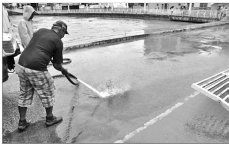
Equipe da Divisão de Limpeza Urbana fez a limpeza rápida das áreas atingidas