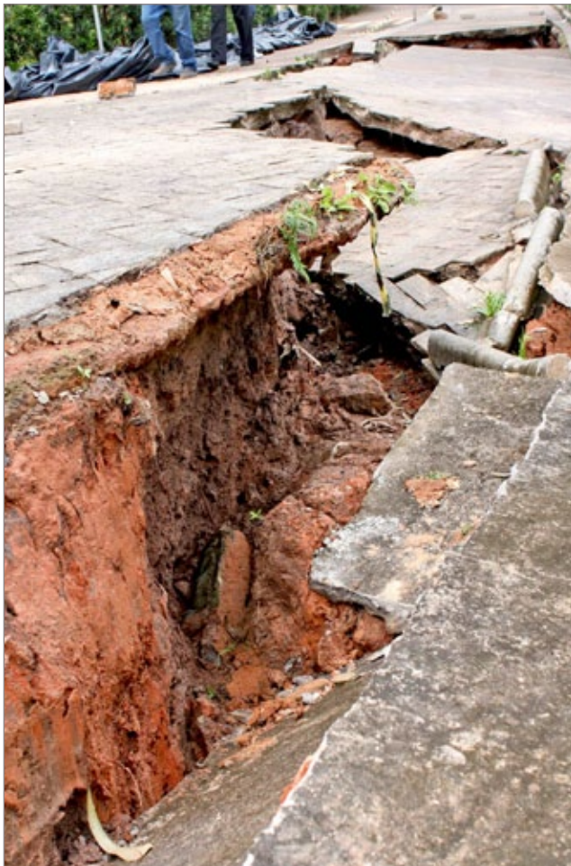
Profissionais da Secretaria de Obras e Serviços estiveram no local para realizar uma vistoria