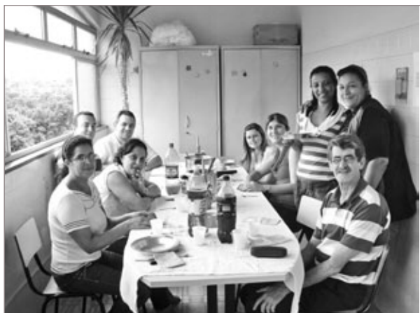
Profissionais da Secretaria de Saúde de Itabirito comemoraram bons resultados de 2011