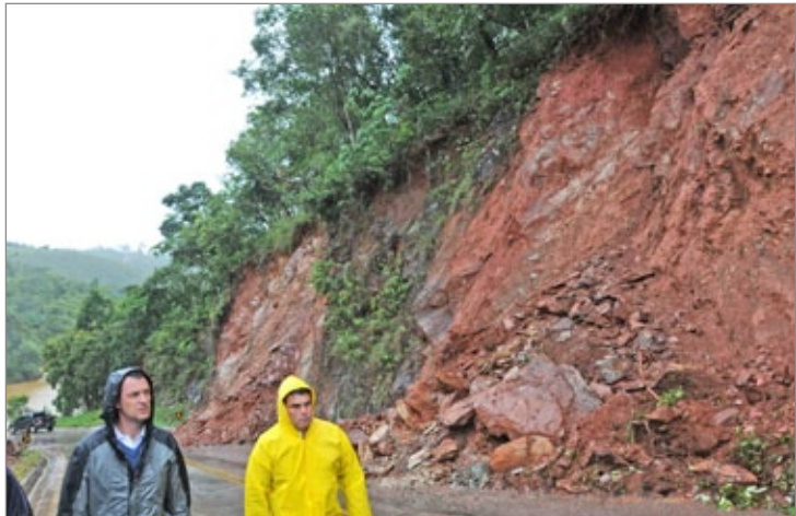
Estrada de acesso a Santa Rita