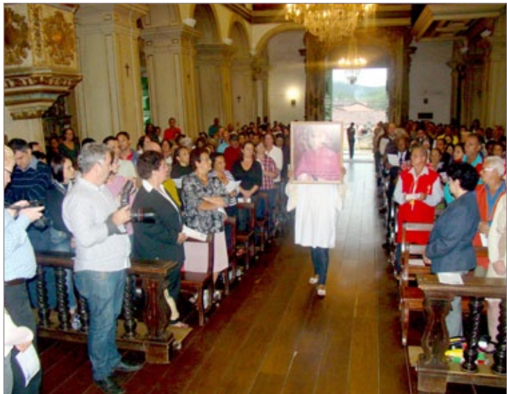
Missa em ação de graças marca o centenário de nascimento de dom Oscar