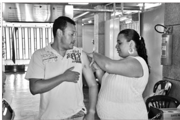
Equipe da Saúde está vacinando pessoas que tiveram contato com a água contaminada