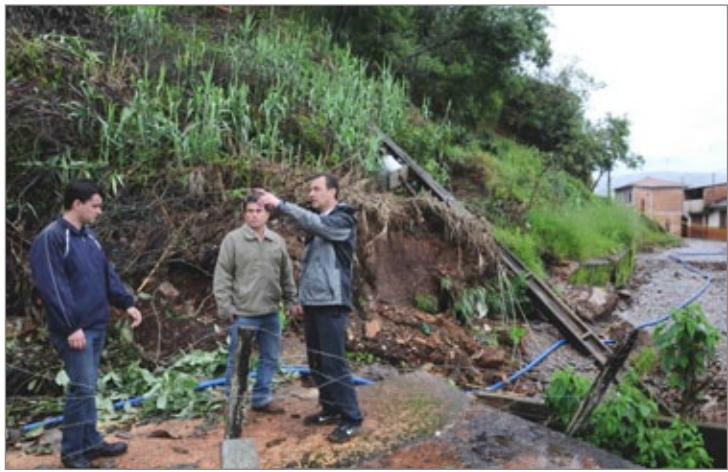
Deslizamento de terra na rua Treze de Maio