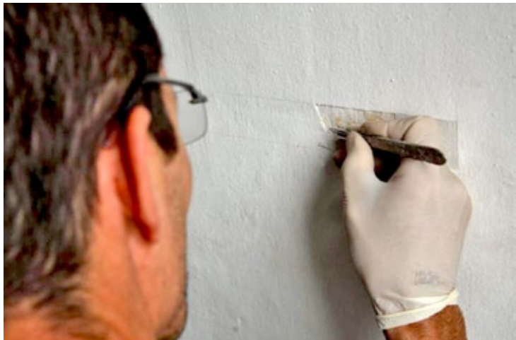
No final do ano passado, uma equipe de restauradores realizou um diagnóstico do estado de conservação da Câmara e identificou as pinturas anteriores

O Serviço Autônomo de Água e Esgoto-SAAE Mariana está realizando uma campanha em prol dos desabrigados tanto para Mariana quanto para a cidade vizinha, Ouro Preto. Quem puder contribuir pode deixar nos postos de arrecadação; utensílios domésticos, calçados, roupas, água mineral e alimentos não perecíveis. Todas as doações serão encaminhadas às famílias que perderam tudo em decorrência das chuvas que caem na região dos Inconfidentes. Toda ajuda será bem vinda. Seja solidário! POSTOS DE ARRECADAÇÃO: Sede Administrativa SAAE: Rua Diogo de Vasconcelos n° 101 – Bairro: Galego; Operacional SAAE: Rodovia dos Inconfidentes n° 1440 – Bairro: Vila do Carmo; Almojarifado SAAE: Rodovia dos Inconfidentes n° 180 – Bairro: Chácara