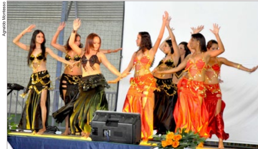
Alunas de Dança do Ventre deram um show à parte para o público