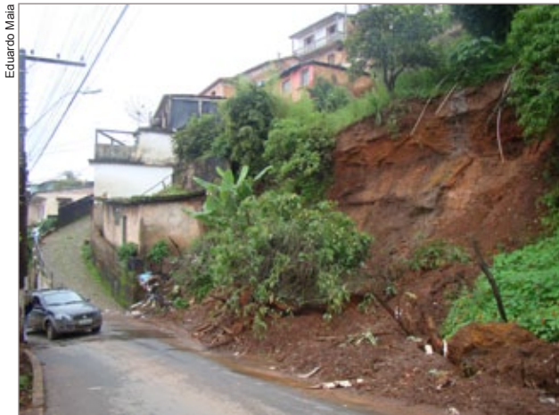
Rua José Elias, no Morro da Queimada