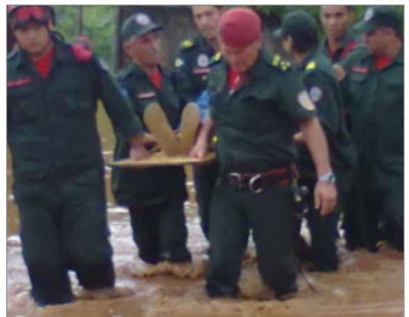
Bombeiros em resgate a morador acamado, no Vila Alegre