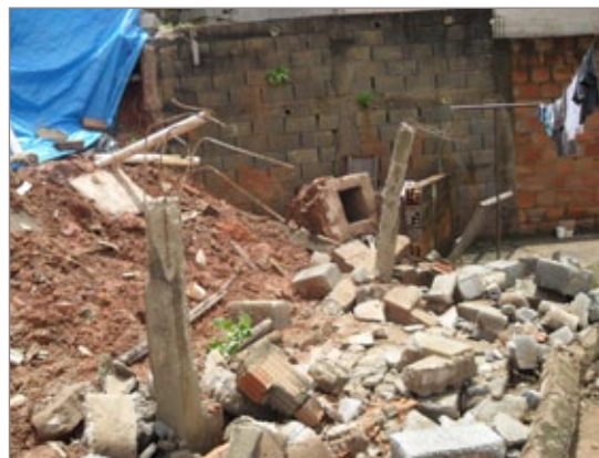
Muro de arrimo demolido por deslizamento no Monte Verde