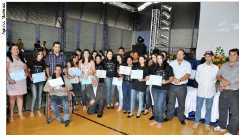
Mais de 1800 jovens receberam o diploma de formação profissional