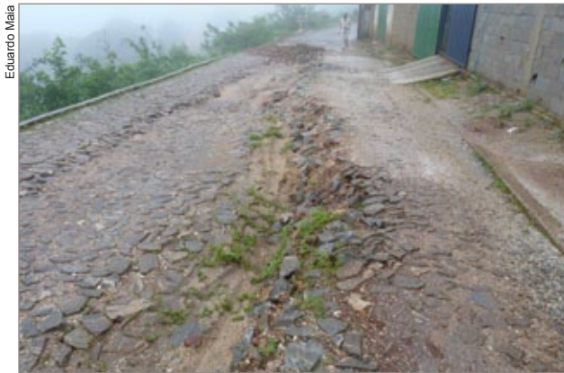
Afundamento da Rua João Goulart, no Taquaral