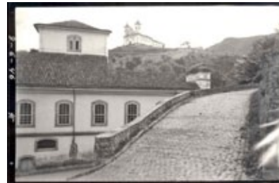
Obras pretendem resgatar elementos tradicionais, à exemplo do que surge nas fotos do acervo de Luiz Fontana