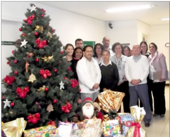
Os presentes comprados respectivamente às cartinhas adotadas, a Diretoria e Colaboradores da Unimed

O principal objetivo da Unimed Inconfidentes é responder às crianças que escreveram ao Papai Noel e atender aos pedidos de presentes de Natal das que se encontram em situação de vulnerabilidade social. Dessa forma, a Cooperativa busca fomentar a solidariedade e a cidadania, promovendo o crescimento social e educacional das crianças.