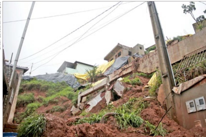
Lincon Zambelli/Jornal Lampião

Um dos locais mais críticos é o Cabanas, onde uma encosta cedeu e destruiu completamente uma casa na Rua Érico Veríssimo. Aproximadamente quatro casas no alto do morro correm risco de desabastecer e foram interditadas pela Defesa Civil. O Santo Antônio (Prainha) e Santa Cruz também estão entre os locais mais afetados. Todos os desabrigados e desalojados foram