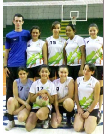
Equipe de Itabirito conquistou o 3º lugar na Liga Mineira de Voleibol