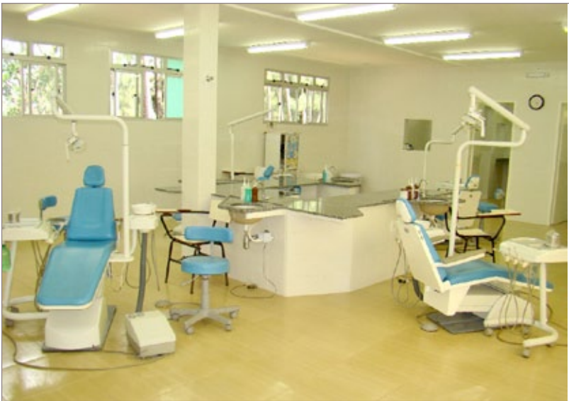
Sala de atendimento individualizado da Unidade Odontológica de Cachoeira do Campo

Pimenta concordou: “Uma bela instalação com todos os equipamentos necessários para o pronto atendimento dentário. Uma obra exemplar da Prefeitura, modelo inclusive para outras cidades. Vai ser de grande utilidade para o povo de Cachoeira e distritos vizinhos”.