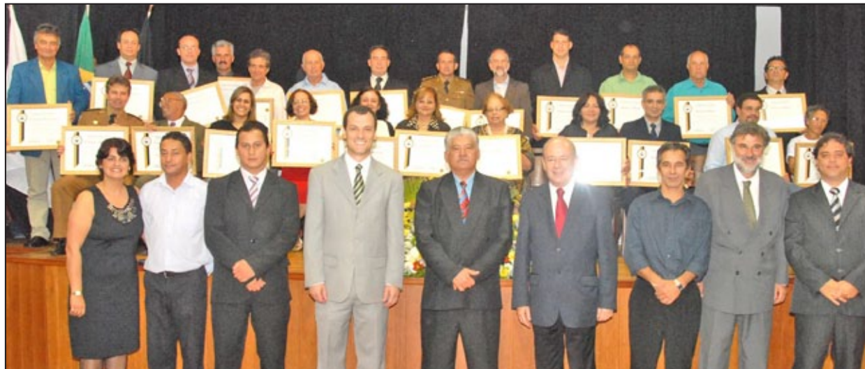
Vereadores e Prefeito de Ouro Preto e agraciados com Título de Cidadania Honorária e Diploma de Honra ao Mérito

A Câmara Municipal de Ouro Preto concedeu, na noite do dia 5 de dezembro, em Sessão Solene realizada no auditório do Colégio Arquidiocesano, 15 Títulos de Cidadania Honorária e nove Diplomas de Honra ao Mérito a pessoas e entidades que contribuem para o desenvolvimento do município.