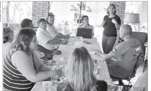
A diretoria da ASSITUR – Associação Itabiritesa do Turismo Rural, associados e representantes do Sindicato Rural, Adesita e Circuito do Ouro reuniram-se para realizar o Planejamento de Ações para o ano de 2012. Dentre as ações propostas estão estratégias de marketing mais competitivas, reformulação do Projeto Caminhadas na Natureza – Anda Brasil e lançamento do Projeto Festival de Turismo Rural. O evento de confraternização entre seus parceiros realizou-se dia 15, quinta-feira última.