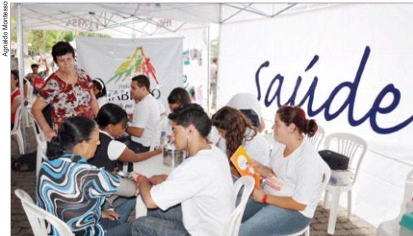
A equipe de Saúde realizou mais de 200 atendimentos durante o dia

Desenvolvimento Social e Combate à Fome. “É com muita alegria que a Prefeitura entrega esse 1º ônibus à Apae. Acredito que se não tivéssemos a instituição no nosso município seria