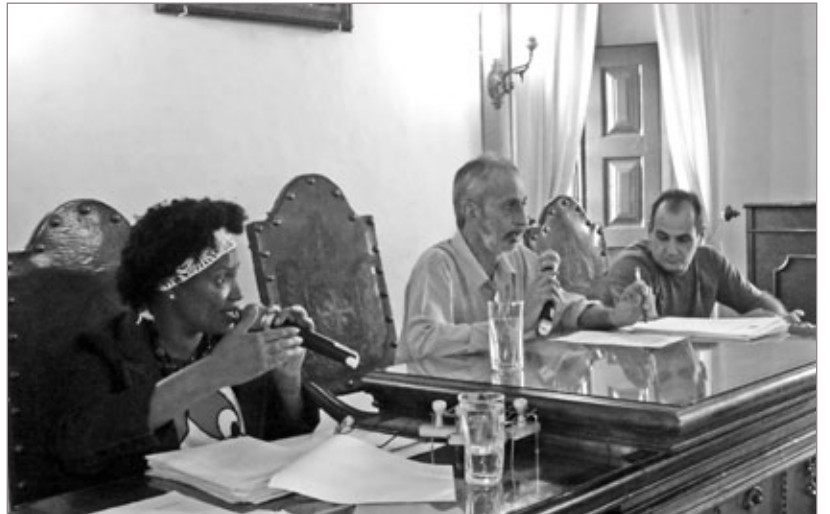
Perseguição a servidores é recorrente na Prefeitura, segundo os vereadores