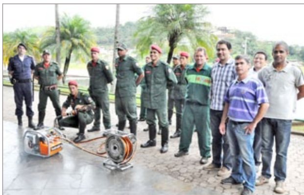
Equipe do Corpo de Bombeiros comemorou equipamento adquirido pela Prefeitura