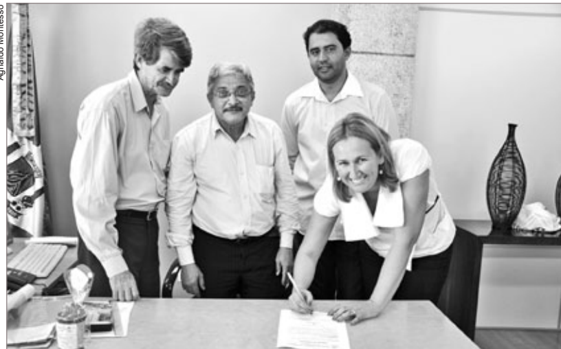
Contrato no valor de R$570 mil foi assinado com a empresa Fixar Engenharia

mil. A Secretária ainda decidiu construir mais um pavimento e modificar parte da estrutura existente no local.