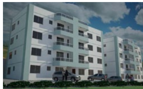
Nossa Senhora do Carmo