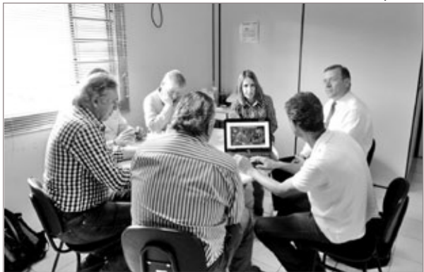
Equipe da nova fábrica da Coca-Cola Femsa de Itabirito se mostrou satisfeita com a qualidade da água

Segundo informe da própria empresa, Minas Gerais é o maior fornecedor de produtos e serviços para a Vale. Cerca de 80% das compras da Vale em Minas são adquiridas de fornecedores do próprio estado. Cerca de R$ 8 bilhões foram desembolsados pela mineradora em compras com fornecedores mineiros, de janeiro a setembro deste ano. São cerca de 1.800 empresas, instaladas em 117 municípios em território mineiro. Minas também é o estado brasileiro com maior índice de internalização – 76% de tudo que a empresa precisa comprar para suas operações locais são adquiridos no próprio estado. O volume adquirido pela Vale em Minas representa cerca de 34% dos R$ 23,6 bilhões desembolsados pela empresa na contratação de fornecedores do Brasil, no período.