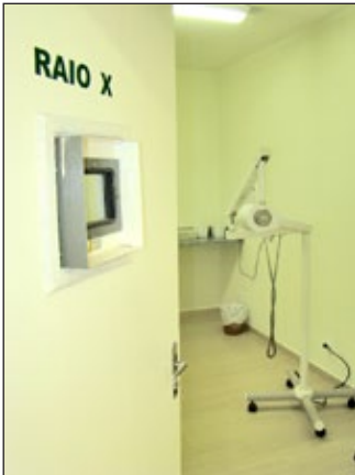
Sala de Raio X da Unidade Odontológica de Cachoeira do Campo