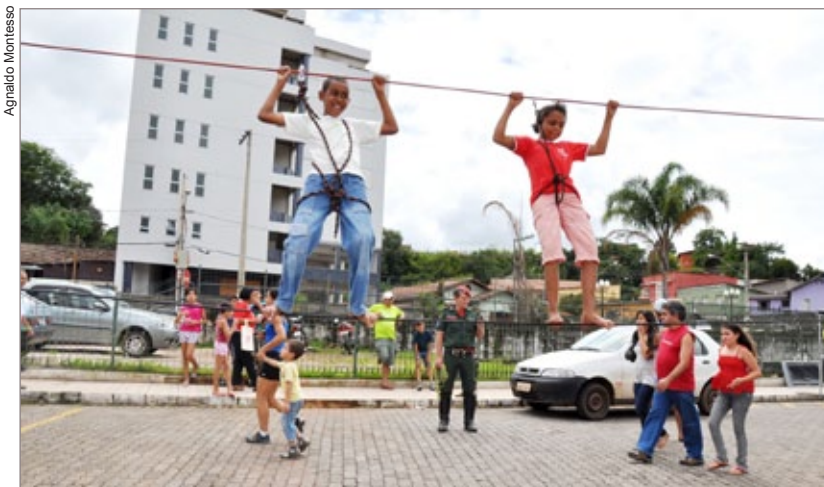
Crianças e adolescentes se divertiram na Praça Femsa da Cidadania