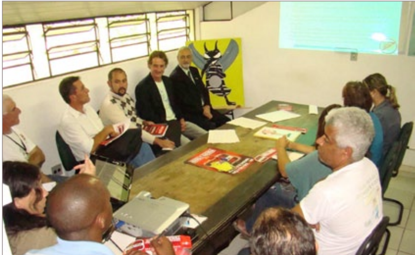
Reunião debateu os resultados da Campanha Todos Contra Dengue