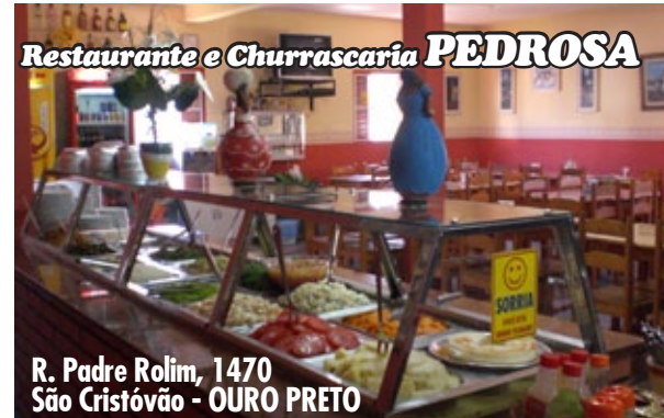
R. Padre Rolim, 1470 São Cristóvão - OURO PRETO

A vereadora destacou em seu discurso que a Prefeitura deveria dar a gratificação aos demais profissionais da Secretaria de Educação, incluindo as cantineiras e as serventes, utilizando os recursos do município, já que elas não podem ser pagas com recursos do Fundeb. Entretanto, para atender a sugestão da vereadora, a administração municipal considera que deveriam ser contemplados todos os profissionais da Prefeitura, e não somente estes dois setores, para tratar de forma justa todos os servidores públicos e, consequentemente, essa decisão onerosa, de forma demasiada, os cofres públicos. Por isso, dentro dos preceitos da responsabilidade fiscal, a Prefeitura de Itabirito está impossibilitada de realizar esta ação.