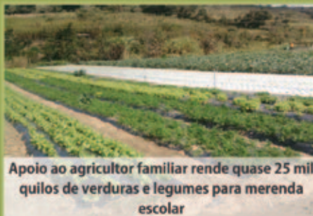
Apoio ao agricultor familiar rende quase 25 mil quilos de verduras e legumes para merenda escolar