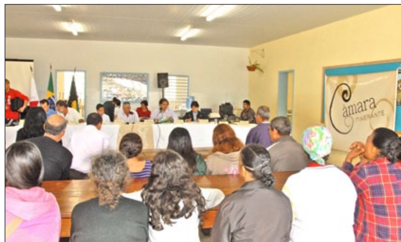
A Câmara Itinerante em Rodrigo Silva contou com grande participação dos moradores

Durante a Reunião dos Vereadores, a comunidade reivindicou melhoria na