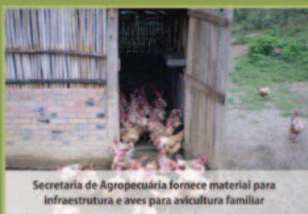
Secretaria de Agropecuária fornece material para infraestrutura e aves para avicultura familiar