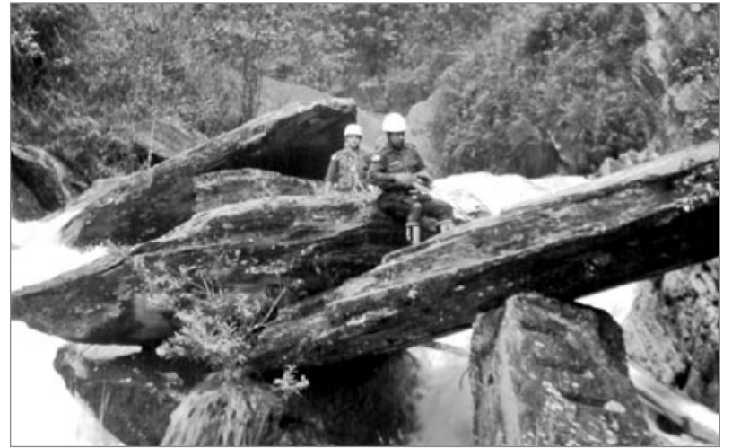
Corpo de Bombeiros de Ouro Preto ajudam a equipe do SAAE/Mariana

Na captação do Santa Efigênia que abastece o distrito de Passagem de Mariana, a bomba parou por diversas vezes durante o fim de semana, devido a pre-