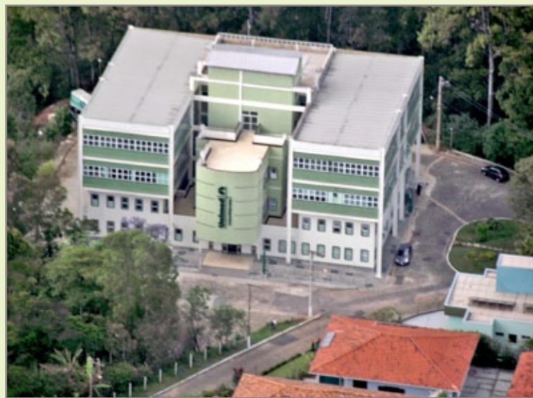
Prédio - sede própria - da Unimed Inconfidentes em Ouro Preto

Comemoramos nossos 25 anos estendendo nossas felicitações aos médicos cooperados, colaboradores, clientes e prestadores de serviços.