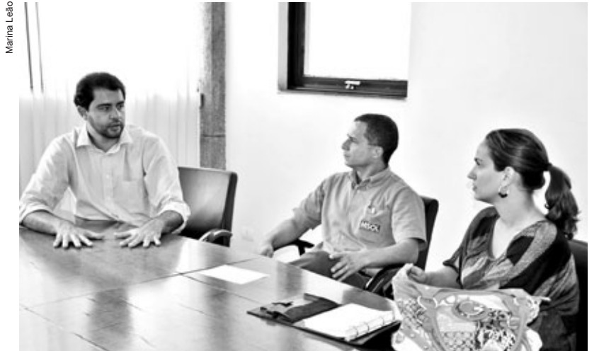
Prefeitura de Itabirito e Msol agem em prol da comunidade do distrito de Acuruí

Diante do acordado na reunião, a empresa, que atua há mais de 5 anos na região, fará, em parceria com a Prefeitura, a recuperação dos 3,7 km de estrada, que liga a vila Morro São Vicente ao distrito de Acuruí, e a administração municipal realizará a manutenção da estrada a partir de então. A primeira visita técnica ao local acontece nesta quarta-feira, dia 30 de novembro, quando engenheiros e funcionários da Prefeitura e da Msol fazem a definição do trecho que será recuperado. "Para a Jaguar é