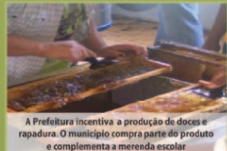
A Prefeitura incentiva a produção de doces e rapadura. O município compra parte do produto e complementa a merenda escolar