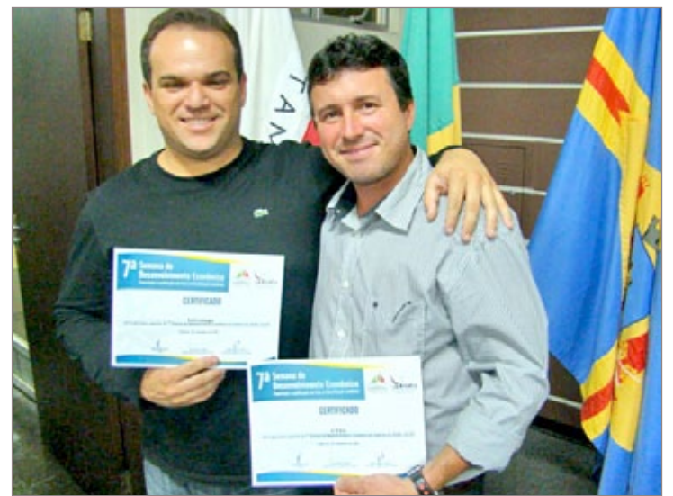
Certificados são entregues às empresas que participaram como expositoras da Semana de Desenvolvimento Econômico

A Câmara Municipal de Itabirito convida a todos para a entrega das Moções de Honra às personalidades que se destacaram por suas relevantes ações em favor da comunidade.