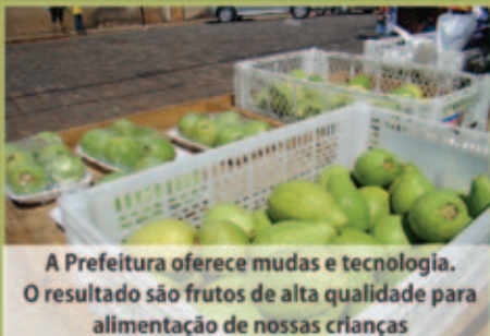
A Prefeitura oferece mudas e tecnologia. O resultado são frutos de alta qualidade para alimentação de nossas crianças