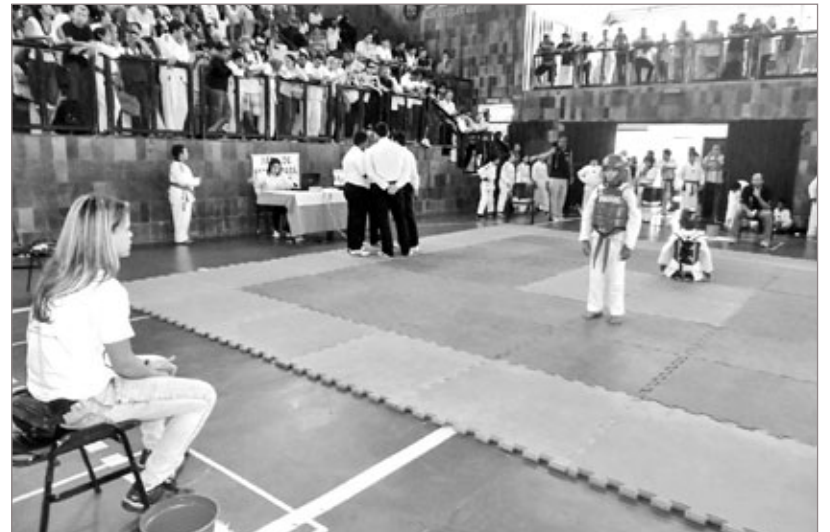
Atletas da Prefeitura de Itabirito conquistaram 33 medalhas na competição