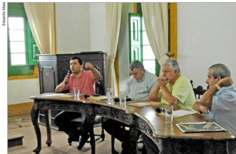
Câmara quer esclarecimentos da Completa Engenharia