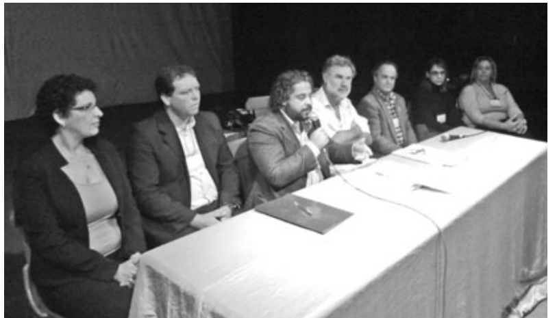
Encontro elegeu propostas que serão apresentadas e pleiteadas por Ouro Preto para receber a Copa de 2014