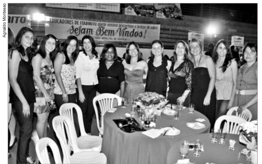
Profissionais da educação se reuniram para uma noite de confraternização e descontração