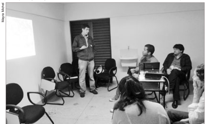
As reuniões acontecem mensalmente e reúnem representantes de Itabirito, Rio Acima e Ouro Preto

A Guarda Municipal e o Corpo de Bombeiros Municipal de Itabirito realizam a campanha “Natal Solidário”. O objetivo é a arrecadação de donativos como cestas-básicas, alimentos não perecíveis, brinquedos e roupas, a serem destinados às famílias carentes de Itabirito. As doações podem ser entregues até o dia 20 do mês em curso, na sede da Guarda Municipal, Rua Engenheiro Simão Lacerda, 515 / bairro Padre Eustáquio, ou na Sede do Corpo de Bombeiros, localizado no Terminal Rodoviário. Caso o doador não possua meios para entrega dos donativos em um dos endereços, favor ligar para os telefones 153 ou 3561-7611.