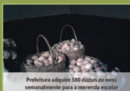
Prefeitura adquire 300 dúzias de ovos semanalmente para a merenda escolar