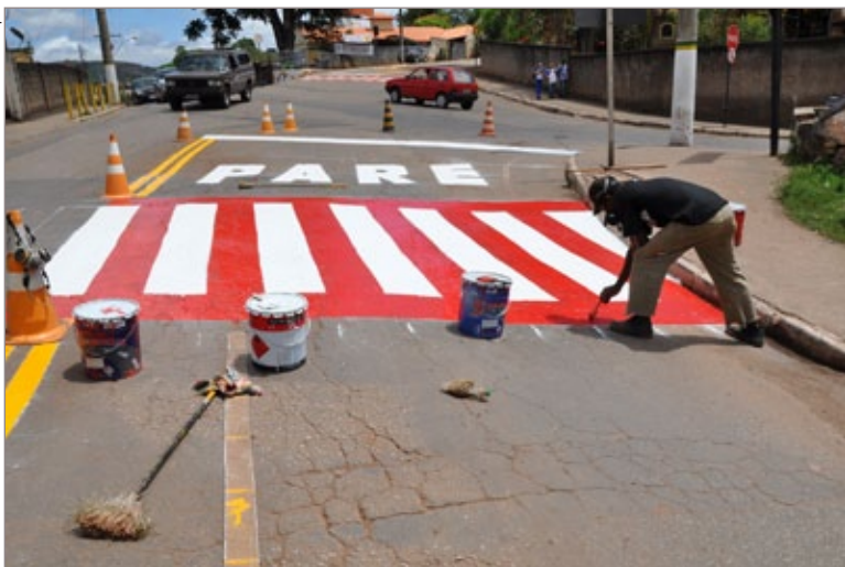
Local foi sinalizado para a segurança dos pedestres e motoristas