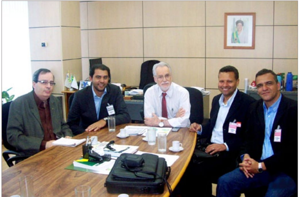
Reunião em Brasília é um grande passo para a federalização do Cefet de Itabirito

A reunião em Brasília foi agendada pelo deputado federal, Gabriel Guimarães (PT - MG), que juntamente com o deputado federal Reginaldo Lopes (PT-MG), apóia o desejo de transformar a escola itabiriteense em uma unidade federal.