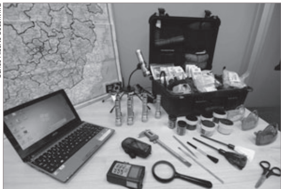
Carlos Alberto Secom/IMG

A aquisição de equipamentos e o treinamento dos peritos criminais têm sido feitos com base em um inédito e detalhado diagnóstico realizado pela Superintendência de Polícia Técnico-Científica, que permitiu levantar a situação e as principais demandas da perícia criminal em todas as regiões de Minas. O levantamento revelou que, em 2010, foram realizadas 230 mil perícias em todo o Estado - cerca de 30% a mais do que no ano anterior. Para isso, os peritos criminais tiveram que percorrer cerca de 1,5 milhão de quilômetros. O diagnóstico detectou também, por exemplo, que 44% das perícias criminais são relacionadas com drogas.