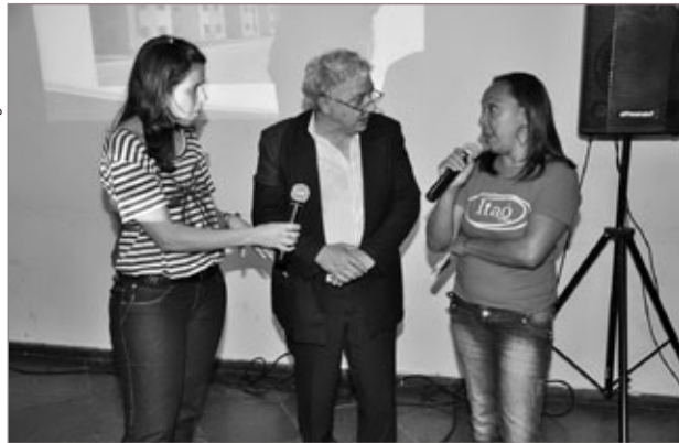
Público pode fazer questionamentos sobre o conjunto habitacional