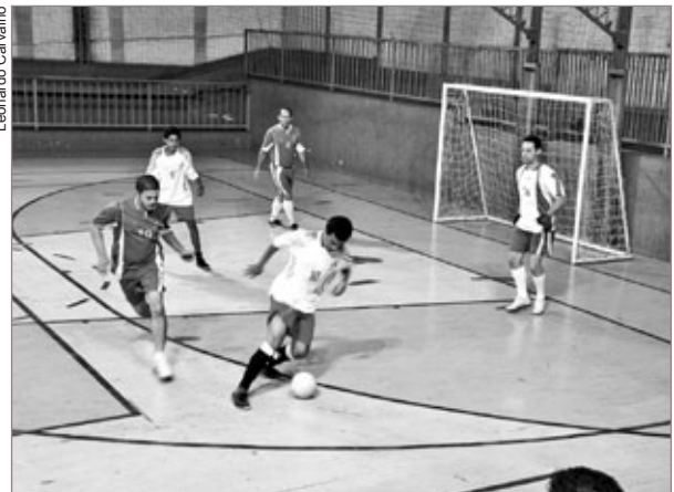
Iniciativa da Prefeitura promove momentos de lazer e integração entre os funcionários

As equipes que conquistarem os três primeiros lugares da competição receberão troféu e medalha. Também serão premiados o melhor jogador, melhor goleiro e artilheiro do campeonato. Em todos os jogos, a entrada é gratuita.