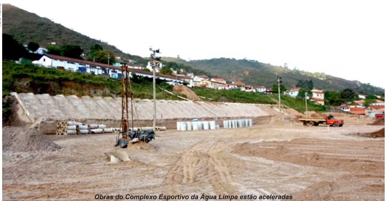
Obras do Complexo Esportivo da Água Limpa estão aceleradas

obras do ginásio estão em ritmo acelerado. Já na Vila do Cruzeiro, em Cachoeira do Campo, o Poliesportivo 25 de Julho foi inaugurado em outubro. Com as obras no Complexo Esportivo da Água Limpa, a população também ganhará outro espaço com pistas para caminhada e corrida.