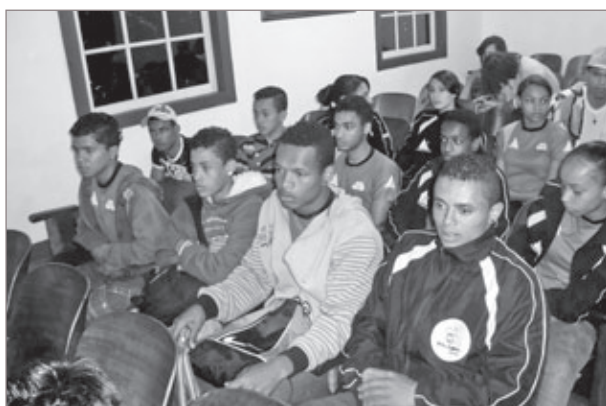
Equipe do projeto marca presença no legislativo de Ouro Preto

Projeto “Esporte e Cidadania” da Fundação Aleijadinho necessita do auxílio para o custeio de despesas durante as competições nacionais e internacionais