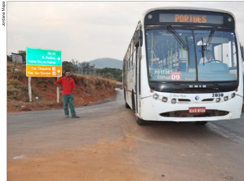
Além do asfalto, a Prefeitura de Itabirito melhora o transporte coletivo no bairro Portões