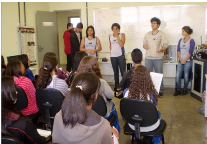
1ª Mostra das profissões foi uma iniciativa do Cefet de Itabirito, em parceria com a Prefeitura