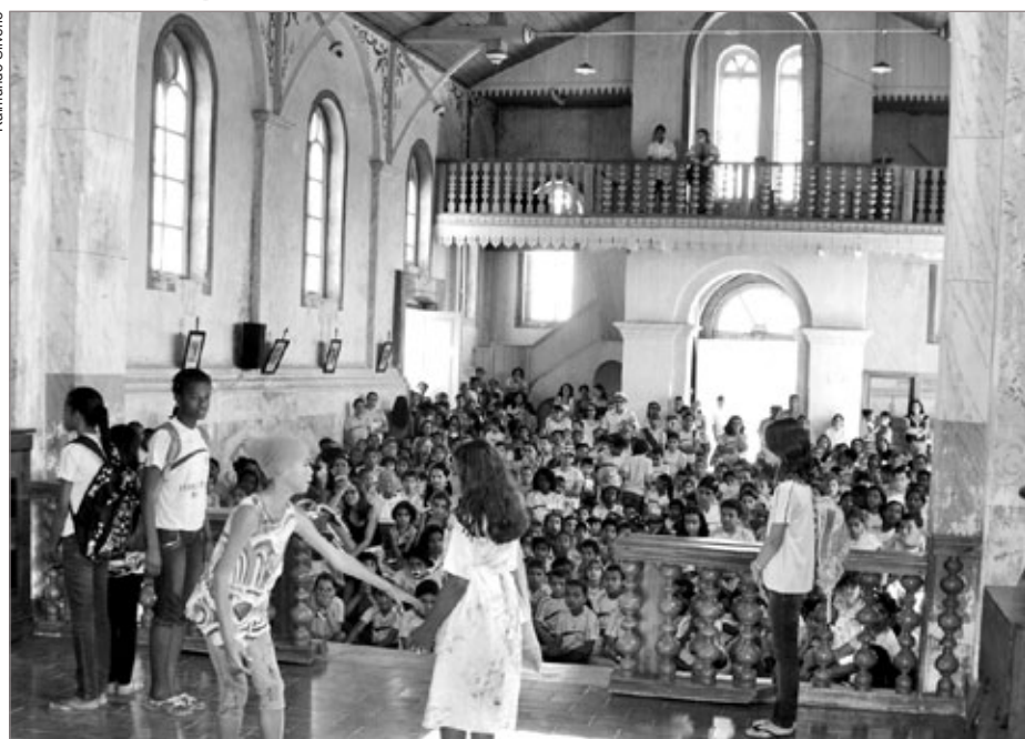
Igreja de São Gonçalo do Bação serviu de palco para peças teatrais