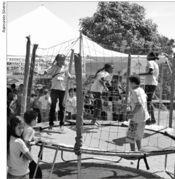
Alunos das escolas rurais de Itabirito se divertiram na Rua de Lazer