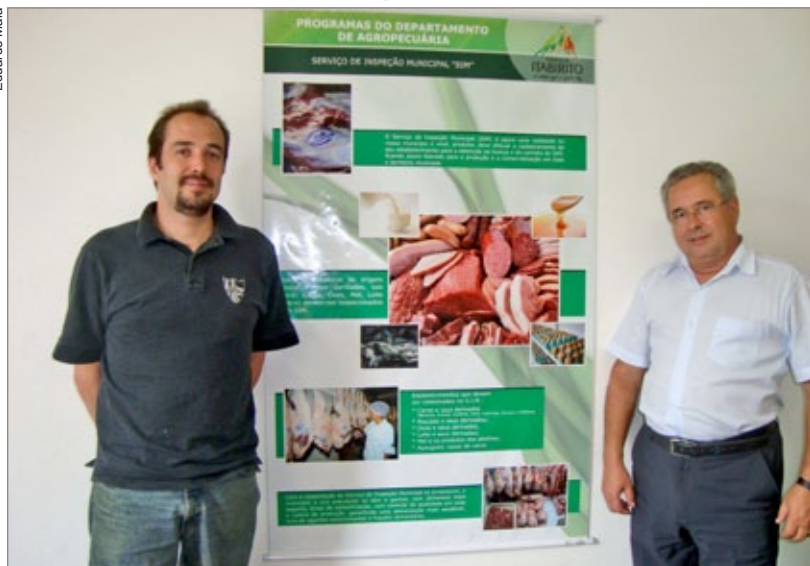
Sistema Municipal de Inspeção visa regulamentar o comércio de derivados de origem animal em Itabirito

de derivados de origem animal entre os Estados e dentro do território de Minas Gerais. “Os municípios de nossa região e de Minas carecem de uma fiscalização mais sistemática desses produtos. Assim, além de atendermos a uma exigência legal, beneficiamos diretamente a população de Itabirito e, em última análise, toda região” complementa.