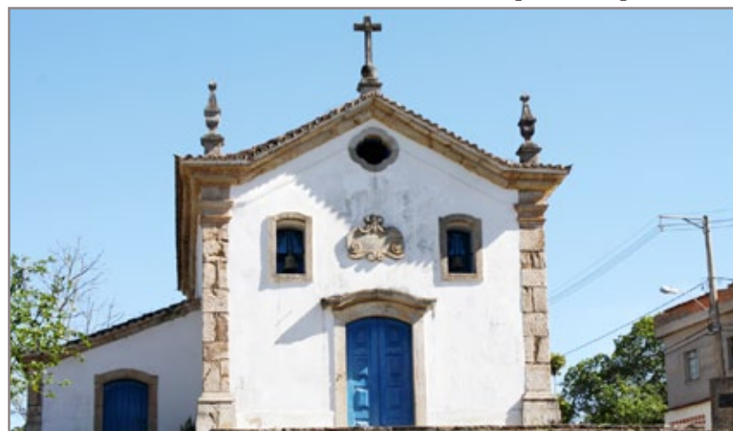
Igreja Nossa Senhora do Rosário, em Itabirito, é tombada pelo Instituto do Patrimônio Histórico Artístico Nacional