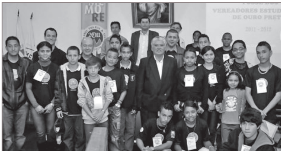
O Projeto conta com a participação de alunos de 10 escolas de Ensino Fundamental de Ouro Preto