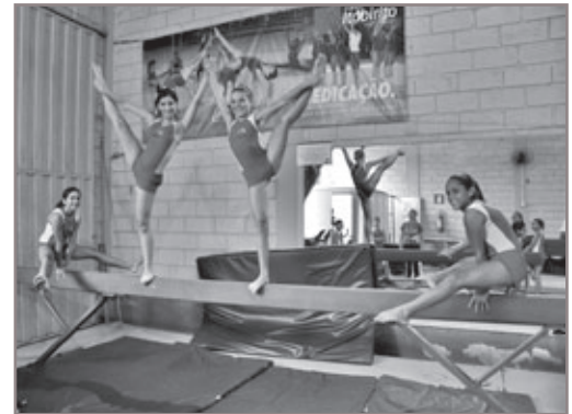
Inscrições acontecem no Núcleo de Treinamento de Ginástica Olímpica, Rítmica e Artes Marciais, das 8h às 11h30 e das 13h