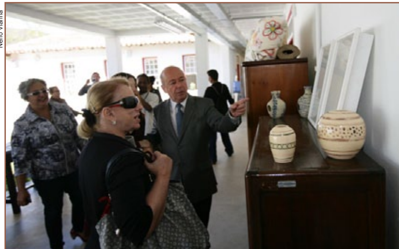
Cerimônia de inauguração da sede do Núcleo de Ofícios da Faop

O Núcleo de Ofícios oferece qualificação profissional para atuação na área da preservação do patrimônio cultural, com ênfase no patrimônio edificado. O novo espaço abrange salas de aula destinadas aos ofícios de carpintaria, marchetaria, alvenaria, pintura e estuque, além de sala de informática, ateliê de papel, e pátios para aulas práticas.