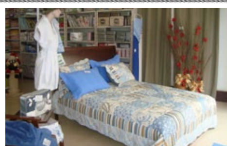
R. João Pessoa, 89 - ITABIRITO - 3561.1762