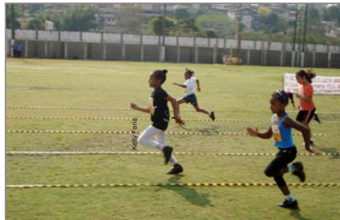
Ação da Prefeitura de Itabirito pretende incentivar e desenvolver jovens atletas para grandes competições na região