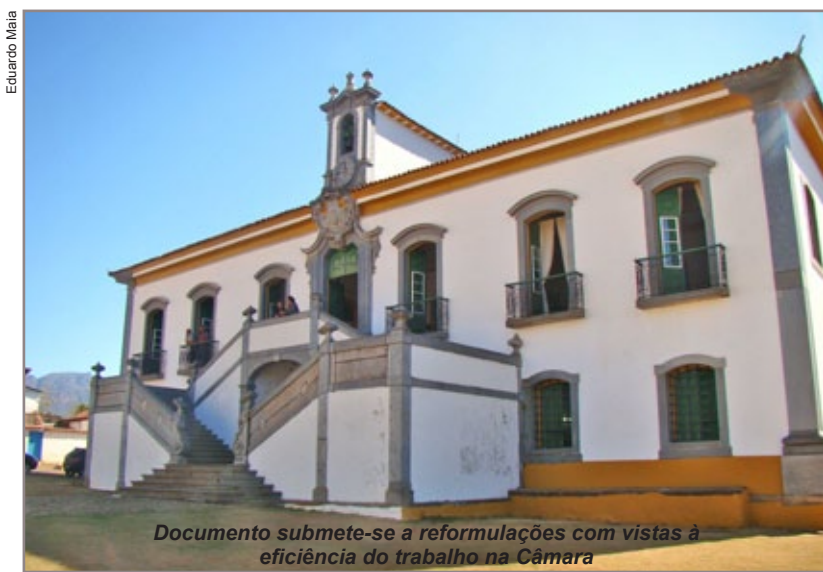
Documento submete-se a reformulações com vistas à eficiência do trabalho na Câmara

“Essas mudanças são necessárias para eliminarmos as contradições e sintonizarmos o regimento interno com as constituições federal e estadual, além de aprimorar e agilizar os