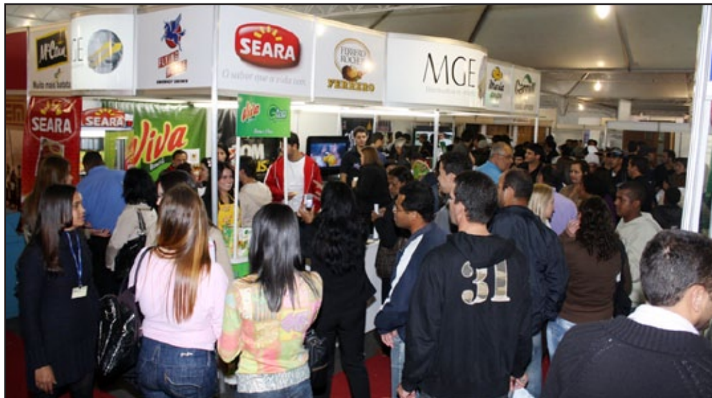
Centenas de pessoas prestigiam a Feira das Empresas do Comércio, Indústria e Prestação de Serviços e Turismo

Mais de 15 mil pessoas são esperadas para a 7ª Semana de Desenvolvimento Econômico, que acontece entre 29 de agosto e 2 de setembro, na Praça de Esportes do Itabirense Esporte Clube. Com o tema “Capacitação e qualificação com foco na diversificação econômica”, o evento conta com palestrantes de renome nacional, como Ciro Bottini , apresentador do Shoptime, que traz a palestra “Um Show de Vendas”; e Dr. Bactéria , do programa Fantástico, da Rede Globo, que fala sobre segurança alimentar.