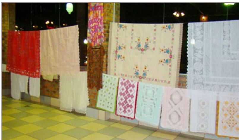
Peças expostas foram confeccionadas pelo Grupo Independente das Mulheres rendeiras de Maceió

Central de Vacinação UAPS Cabanas UAPS Passagem UAPS Santo Antônio Unidade de Pronto Atendimento (UPA) Escola Municipal Dom Luciano (Rosário) Igreja do Rosário Terminal Turístico