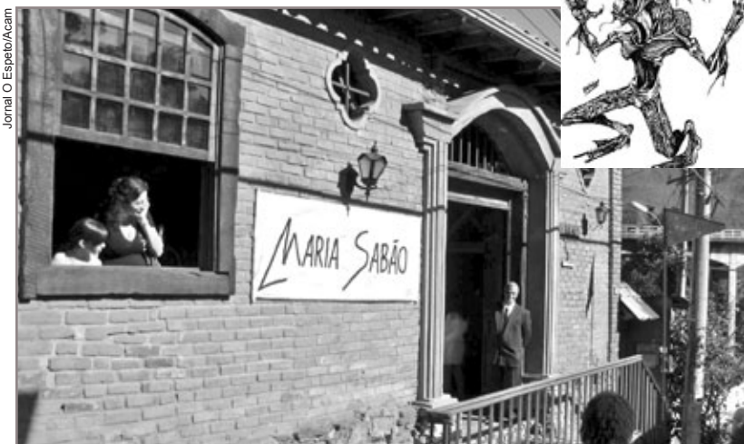
No Espaço Cultural Maria Sabão, em Passagem, funcionará a sede da Associação de Caçadores de Assombrações. No detalhe, retrato falado do Caboclo d'Água