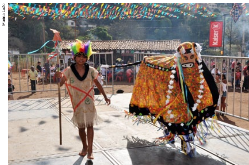
Alunos da E. M. Laura Queiroz fizeram a apresentação da Dança do Boi Bumbá