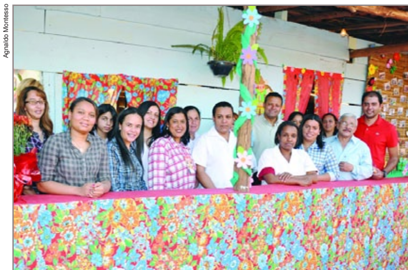
11ª Festa do Pastel de Angu é uma realização da PMI com a comunidade escolar