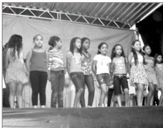
A comunidade do bairro São Cristóvão/Ouro Preto viveu momentos de sua festa do gênero junina (apesar de ser agosto), no último fim de semana, dias 5, 6 e 7.