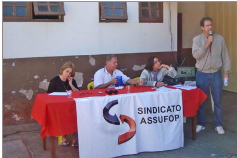
Retorno dos servidores ao trabalho não significa fim do movimento grevista na UFOP

Segundo informação, a própria Ufop seria uma das requerentes no processo. “Durante as reuniões do Conselho Universitário (Cuni) fomos informados que o AGU protocolou o pedido à revelia da