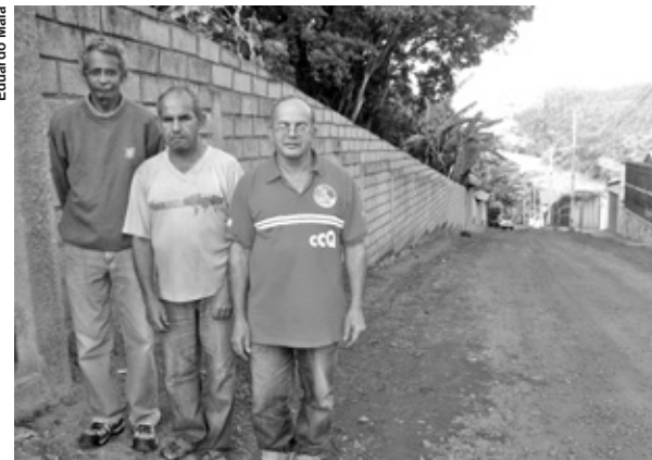
Calvário enfrentado pelos moradores da Rua Sagrada Família dura desde a implantação da rua, há mais de 10 anos

Em agosto de 2010, Câmara de Ouro Preto chegou a sugerir a inclusão do calçamento e da rede esgoto no Orçamento Participativo, mas segundo os moradores a proposta não vingou. Para agravar a situação, a Secretaria Municipal de Obras e o Sema não prevêem tão cedo a execução de melhorias. Segundo informação, a obra para a implantação da rede de esgoto “seria de um valor alto, visto que englobaria um projeto envolvendo rede de esgoto no bairro Dionísio, onde desaguaria, e