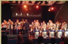
ORQUESTRA TABAJARA 17/07