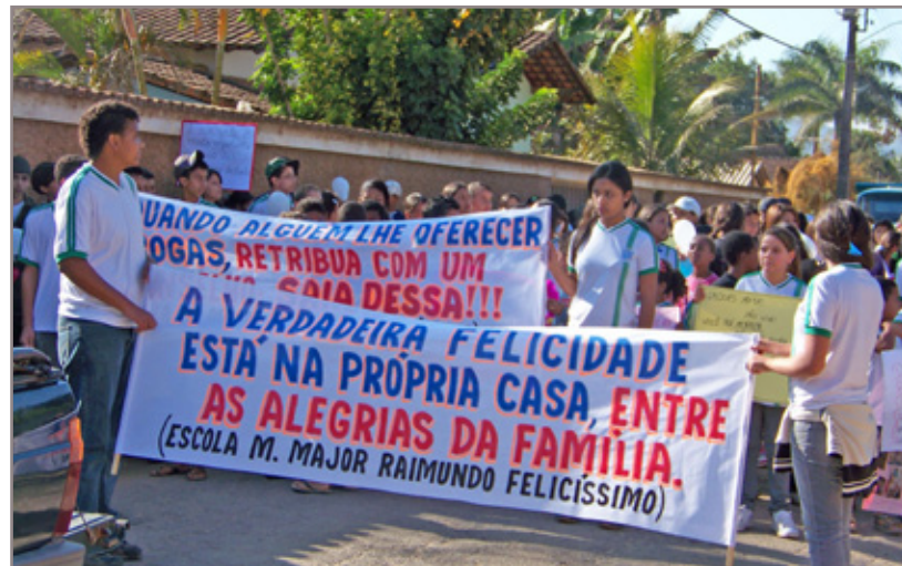
No último dia 9, escolares de Amarantina/Ouro Preto saíram em passeata em prol da prevenção contra o uso de drogas, ao se encerrar a primeira semana do projeto "100" Drogas. O evento teve a participação da comunidade local, dos professores e representantes do CMDCA