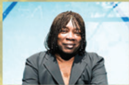
MILTON NASCIMENTO 16/07