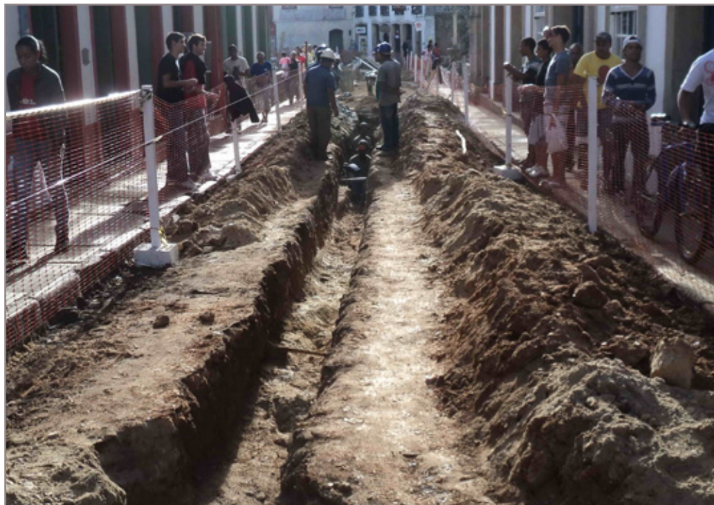
Obras na rua São José