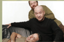
OS PARALAMAS DO SUCESSO 22/07