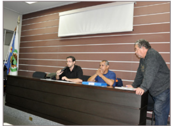
O encontro visou regularizar e resolver os problemas dos taxistas de Itabirito