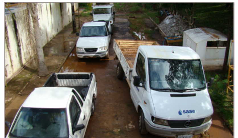
Veículos abandonados pela gestão anterior