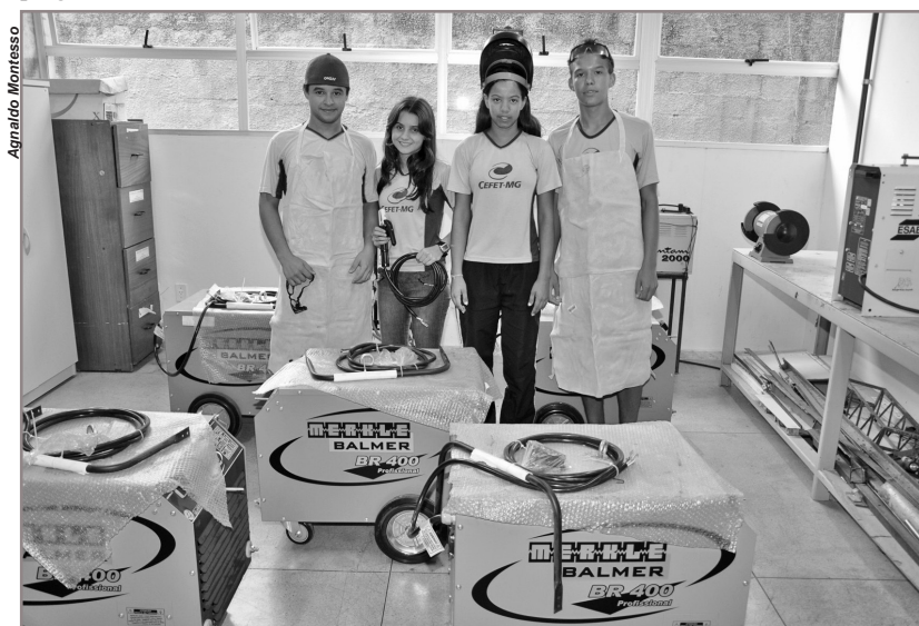
Novo Laboratório de Soldagem beneficiará cerca de 300 alunos do Cefet e do Cemi