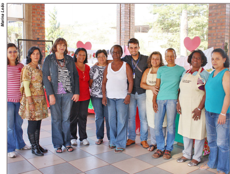
Grupo de artesãs do Clube de Mães de Itabirito estão animadas com as vendas para Dia das Mães 2011

Durante os dois dias de evento, várias opções de lembranças, presentes, quitutes, artesanatos, artigos de decoração, dentre outras coisas produzidas pelos artesãos da cidade, estarão expostos na Praça da Estação. Prestígie!