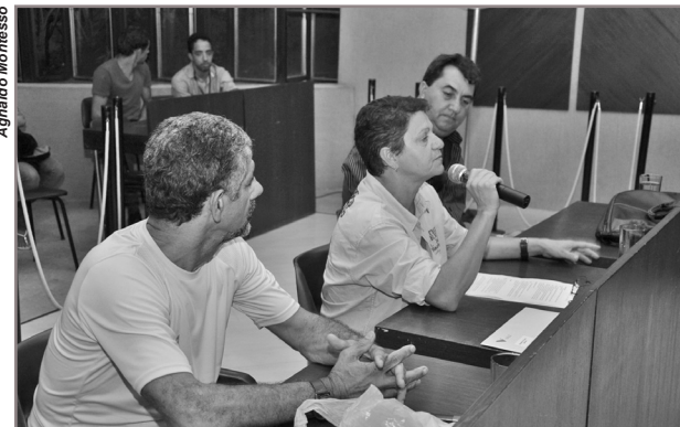
Vereadores puderam esclarecer diversos pontos relacionados à educação

Ricardo Francisco também frisou a aquisição de 2.835 novos móveis para todas as escolas, com um investimento de