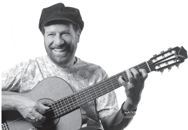
O cantor e compositor João Bosco participa das comemorações dos 20 anos de atividades da Fundação Sorria, com show beneficente a se realizar dia 23 deste, às 21h30 no Centro de Artes e Convenções da UFOP. João Bosco é colaborador constante da Fundação Sorria e sempre ajuda nos eventos beneficentes. Nesta apresentação, o cantor traz seu grupo musical completo.

O Clube de Mães N. Sra de Nazaré, vinculado ao Lions Clube Cachoeira do Campo completa 20 anos de atividades, neste domingo, 10 de abril. O ponto alto das comemorações relativas à data é a inauguração da brinquedoteca e mini-biblioteca "Sonho de Criança" na Creche do bairro Alto do Beleza.