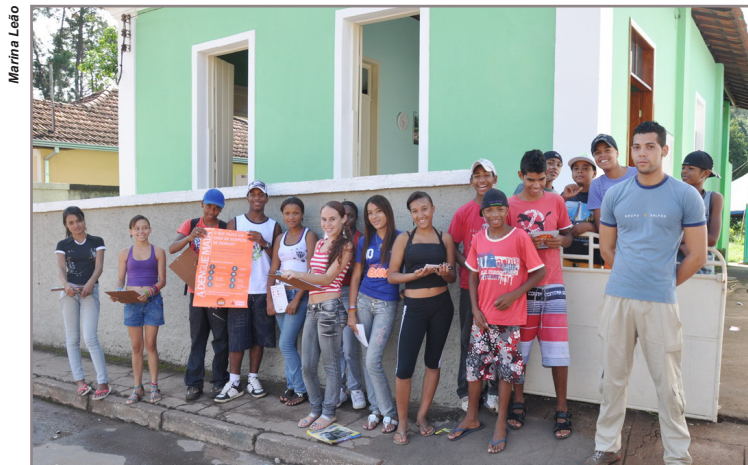
Divididos em grupos, os jovens repassaram o que aprenderam no Cras para os moradores da região