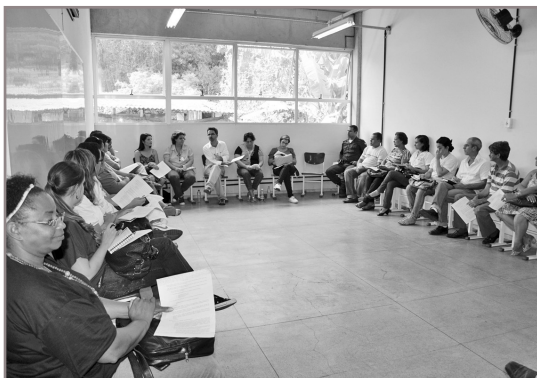
Dia da Luta Antimanicomial já é tema de reuniões promovidas pela Prefeitura de Itabirito