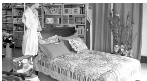
Marca exclusiva da Loja da Fábrica

R. João Pessoa, 89 - ITABIRITO - 3561.1762