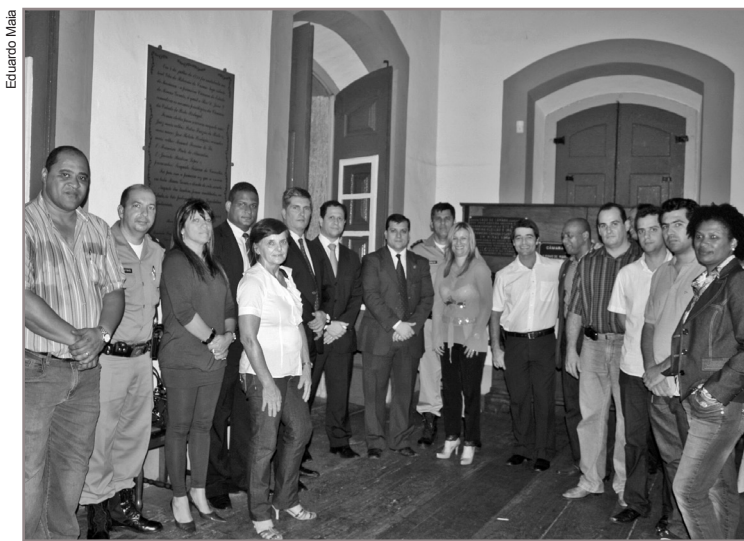
Autoridades do poder legislativo e judiciário chancelaram a implantação da Suapi em Mariana

A unidade prisional passa a contar com cerca de 60 agentes penitenciários (10 mulheres) dois