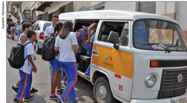
Alunos da Rede Municipal de Ensino contam com mais segurança e conforto no transporte gratuito