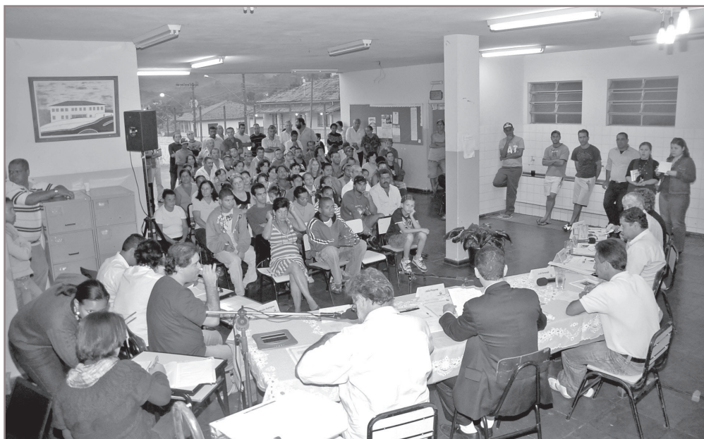
Neste ano, a Câmara Itinerante inicia as atividades em março