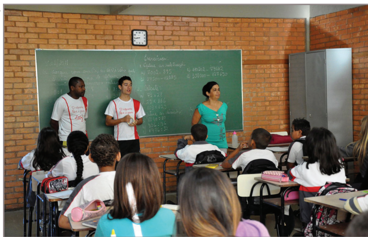
Durante a explicação nas escolas a equipe esclareceu dúvidas dos alunos

e feminina, em duplas; e, a partir de 18 anos, os atletas se organizam em quartetos ou duplas, com equipes masculina e feminina. Mais informações na Secretaria de Esporte e Lazer, localizada no Anexo I da Prefeitura, à Avenida Queiroz Júnior, 620, Centro, 2º andar (no prédio da Caixa Econômica), de segunda a sexta, das 8h às 17h, levando um documento de identidade.