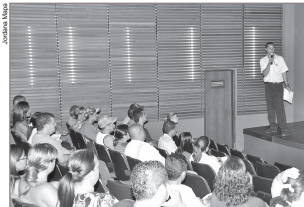
O coordenador da Vigilância Sanitária explicou as obrigações dos ambulantes com a venda de alimentos