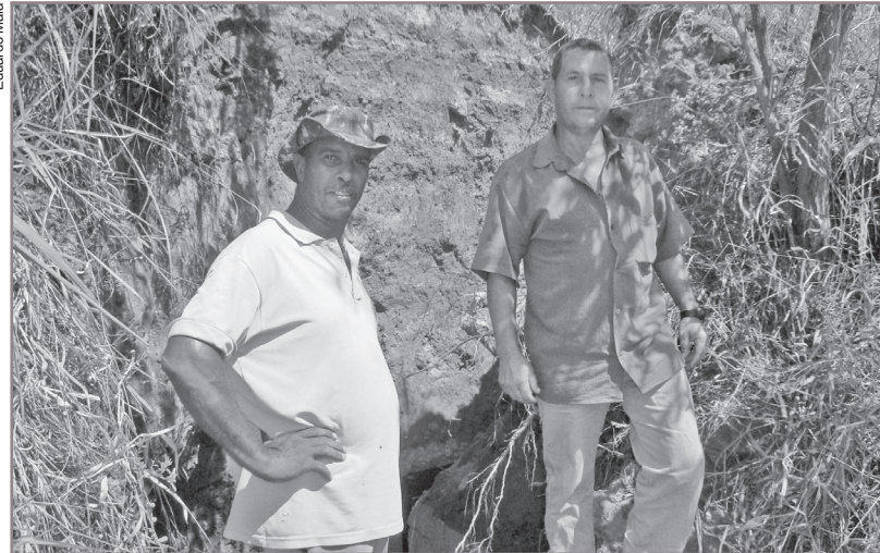
Moradores do Maracujá temem desastres na estrada com o rompimento da galeria de rede pluvial