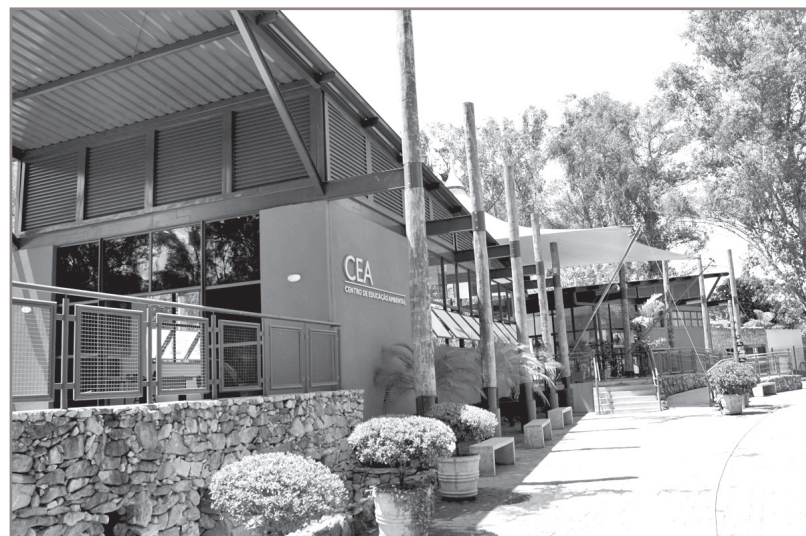
Dois contenedores estão disponíveis no CEA para a população descartar o óleo usado, de terça a sexta, das 8h às 17h