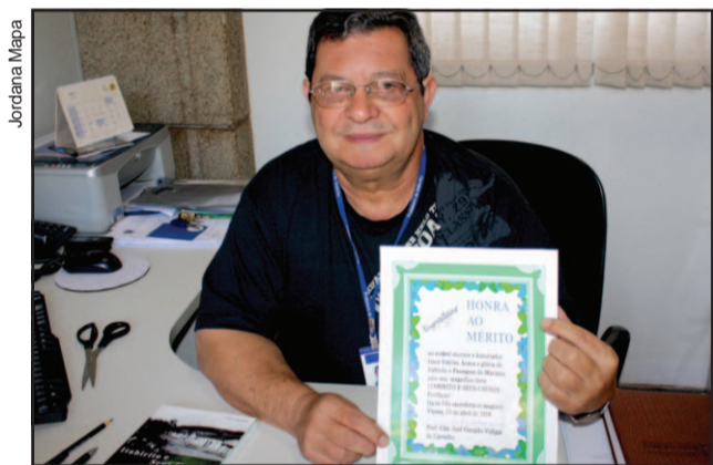
Escritor e secretário de Comunicação da Prefeitura recebe homenagem pela obra ‘Itabirito e Seus Causos’

“Itabirito e seus causos”, trás contos sobre curiosidades do passado, com uma rica pesquisa histórica de bons perso-