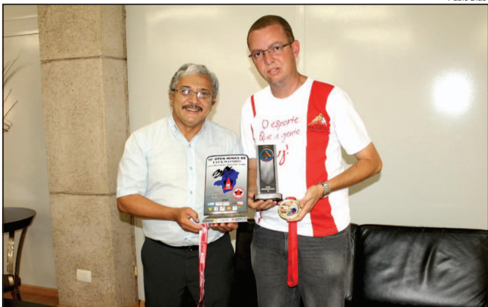
Manoel da Mota recebe as medalhas conquistadas com apoio da Prefeitura de Itabirito

O Prefeito Manoel da Mota recebeu, das mãos do Secretário Municipal de Esportes e Lazer, Rodrigo Espigão, o Troféu e a medalha conquistados com o 2º lugar pelo futebol de salão masculino, na 1ª etapa dos Jogos do Interior de Minas (Jimi). Na ocasião, foi entregue, também, troféu e medalha em comemoração ao 3º lugar geral no Open Minas