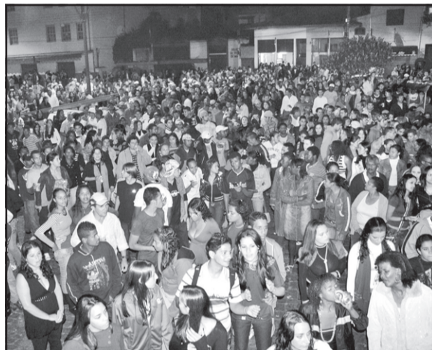
Uma verdadeira multidão compareceu à Praça Tancredo Neves para comemorar o Dia Internacional do Trabalhador