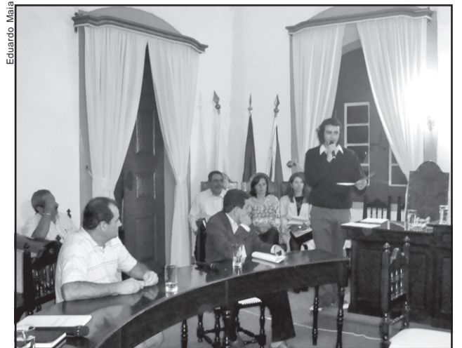
Integrantes da Rede Cultural de Mariana buscam apoio em prol da cultura local

Conheça a Rede Cultural Sem vinculação partidária, a Rede Cultural surgiu na I