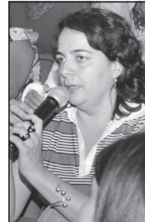
Ex-secretária quer explicações da Administração Municipal

Denuncie qualquer irregularidade de seu conhecimento para a Polícia Militar, por meio dos telefones: Ouro Preto: 3552.3598/190; Mariana: 3558.2488 / 3557.1122 / 190; Itabirito: 3561.3020 3561.0300 / 190 Disque denúncia: 181