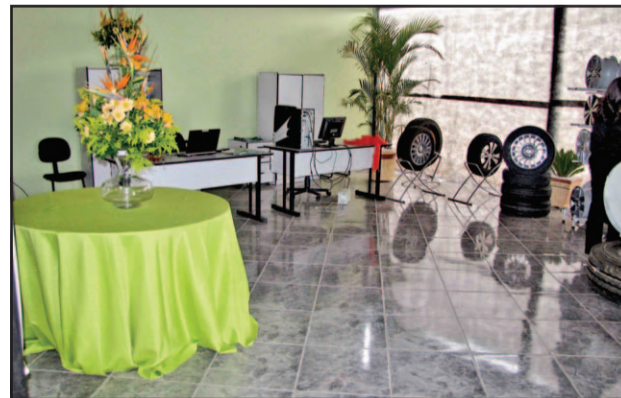
Show-room das novas instalações