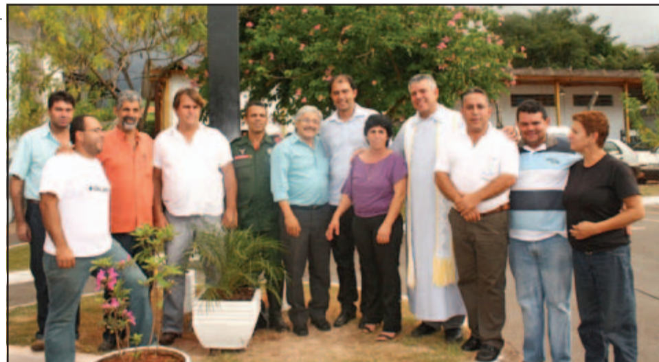
Na oportunidade, uma nova cruz foi abençoada no estacionamento da Prefeitura

Para comemorar o Dia do trabalhador, servidores da Prefeitura de Itabirito se reuniram na sexta-feira, dia 30 de abril, para participação de uma missa em Ação de Graças. Celebrada pelo Pároco da Matriz de Nossa Senhora da Boa Viagem, Padre Miguel Ângelo Fiorillo, a solenidade também foi marcada pela ben-