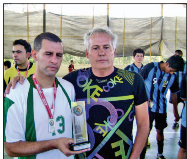
Troféu do vice campeonato é resultado do grande investimento da Prefeitura nos últimos meses