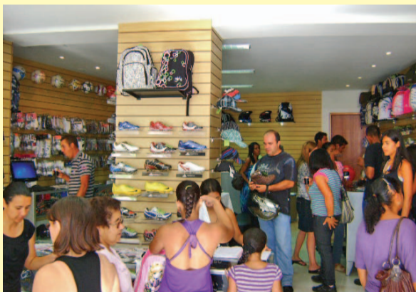
O público lotou a loja durante a inauguração