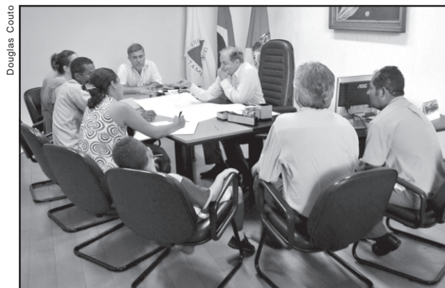
Prefeito se reúne com as associações de moradores