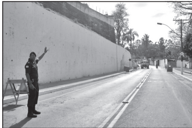
O trabalho dos Anjos da Guarda será intensificado para garantir a segurança dos alunos