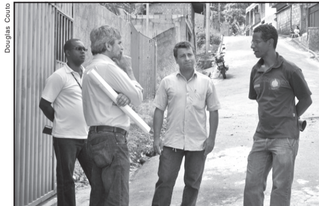
Representantes da Prefeitura foram guiados pela Associação de Moradores do Vale Verde em visita ao local