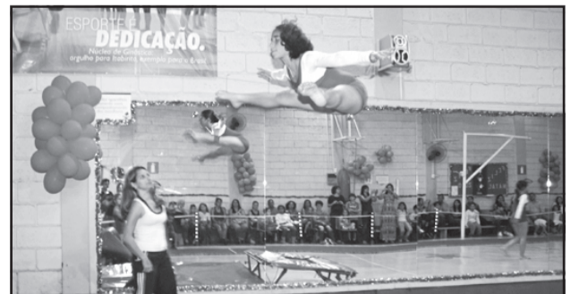
Os novos alunos poderão contar com melhor estrutura em 2010

A Prefeitura de Itabirito abre inscrições para o Núcleo de Treinamento de Ginástica Artística, Rítmica e Artes Marciais. A partir do dia 29 de janeiro, sexta-feira, das 8h às 18h, estarão disponíveis os seguintes cursos: - Ginástica Artística (Ginástica Olímpica), para alunos de 4 até 17 anos; - Taekwondo de 5 até 17 anos; - Ginástica Aeróbica, para maiores de 16 anos; - Ginástica Localizada, para maiores de 16 anos; - Ginástica Máster, para maiores de 50 anos.