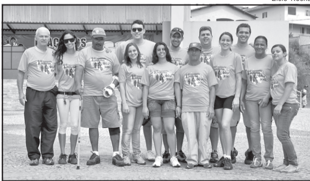
Equipe da Secretaria Municipal de Desportos, promotora do passeio.