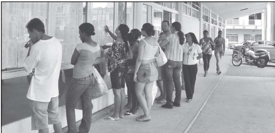
Resultado do processo seletivo em Mariana

O fato de Mariana não é isolado no cenário da Região dos Inconfidentes, e observa-se que poucos municípios fizeram concurso público, valendo-se do recurso de processo seletivo para escolha dos funcionários. Mas há um exemplo maior: o próprio governador Aécio Neves não realizou concurso público para regularização de vagas, valendo-se de “efetivação” pela Lei Complementar nº100, de 06/11/2007, para todo o Estado de Minas Gerais.