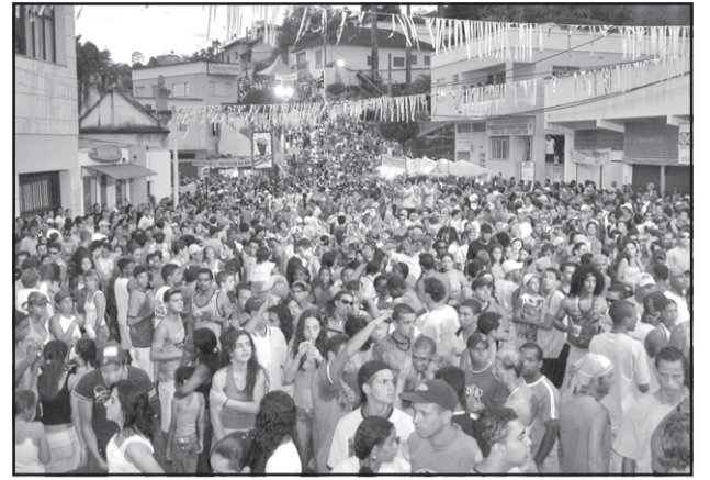
Mais de 200 profissionais foram contratados pela Prefeitura para garantir a segurança do folião no Carnaval 2010

ado na esquina do sinal, onde está o "bar do Zé Brás", para a Rua Dr. Eurico Rodrigues sentido Isap, deixando o condutor impedido de seguir na Rua Emídio Quites.