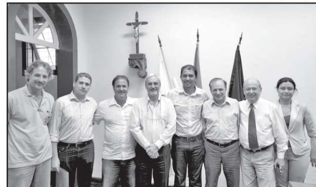
Prefeitos da AMINC decidem a criação de consórcio regional