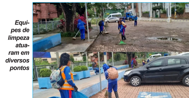
Equipes de limpeza atuam em diversos pontos