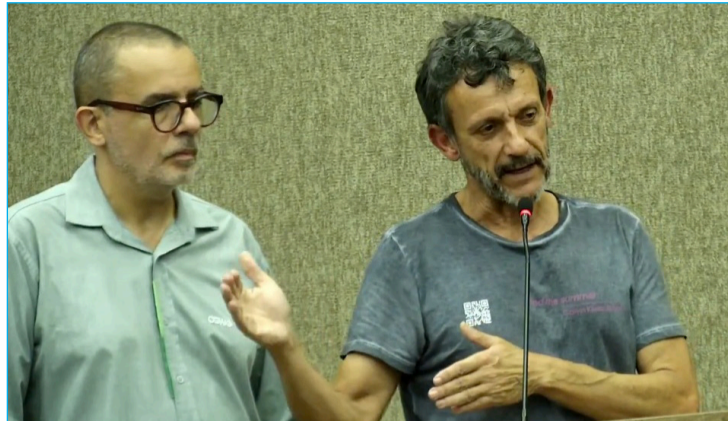
Representantes da Cemig

Outro ponto que chamou atenção foi a explicação sobre as quedas de energia. Segundo os representantes, fatores externos estão entre as principais causas, com destaque para