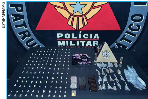
Submetralhadora artesanal, drogas e materiais apreendidos

Na bolsa que ele carregava, e que foi descartada durante a tentativa de fuga, os militares encontraram uma submetralhadora artesanal calibre 9 mm, com cinco munições e um carregador. Também foram apreendidos 143 pedras de crack, 23 buchas de