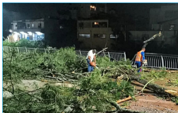
Chuvas causaram queda de galhos e troncos

Apesar dos danos materiais e dos transtornos registrados em diferentes pontos da cidade, não houve registro de pessoas feridas.