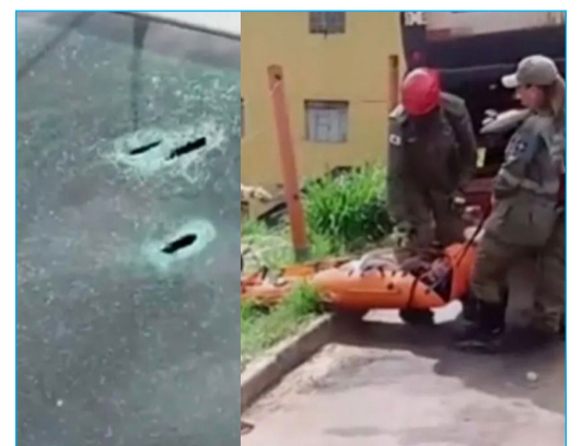
Montagem com imagens que circulam nas redes sociais das marcas de balas no veículo e resgate de homem envolvido no caso

A reportagem tentou contato com as forças de segurança, mas não obteve retorno com informações oficiais até a publicação desta matéria. O caso deve seguir sob investigação.