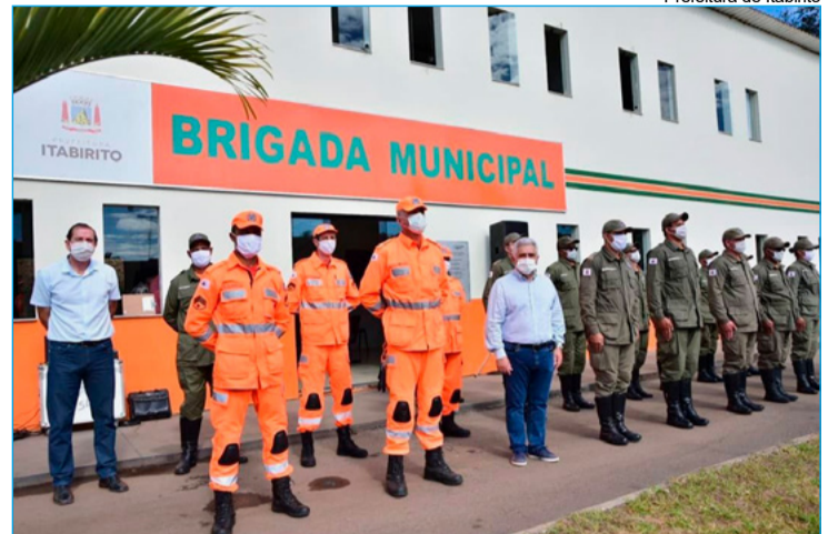
Cerimônia de entrega da Brigada Municipal, em 2020

“O clima na corporação ficou muito ruim. O pessoal ficou bastante chateado, porque depois desse tempo todo, não teve sensibilidade nenhuma da prefeitura. A prefeitura não teve compaixão, empatia para conosco, que estivemos prestando esses serviços para a cidade há tanto tempo”, revelou um dos brigadistas dispensados, em entrevista ao Jornal O Liberal, que preferiu não se identificar. Ele informou que se trata exatamente de 13 brigadistas,