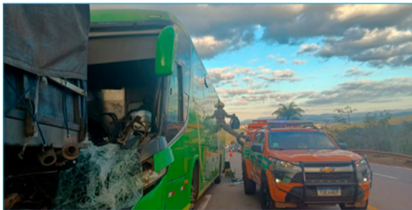
Colisão entre ônibus e carreta assustou quem passava pelo local

Os casos reforçam a atenção para o trecho, que é conhecido pelo alto índice de acidentes. Apesar das ocorrências, o número