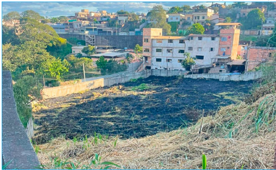
GCM Itabirito via Radar Geral

Questionado, o homem teria admitido ter iniciado o fogo, alegando que a intenção era queimar "apenas mato". No entanto, ele não apresentou justificativa legal para a prática, sendo conduzido e preso em flagrante por crime ambiental. De acordo com a Lei de Crimes Ambientais (Lei nº 9.605/1998), provocar incêndio em áreas urbanas ou rurais sem autorização é considerado infração, podendo resultar em multa e até detenção, dependendo da gravidade e das consequências do ato