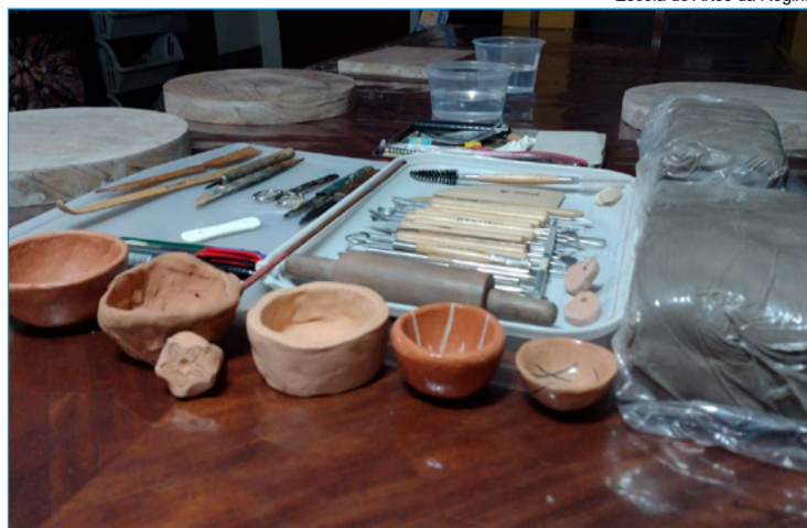
Escola de Artes da Regina

Rua Dona Yolanda Guimarães, n. 250, em Passagem de Mariana - Mariana. As inscrições para a oficina podem ser realizadas pelo telefone: (31) 9 8624-8643. As vagas são limitadas.