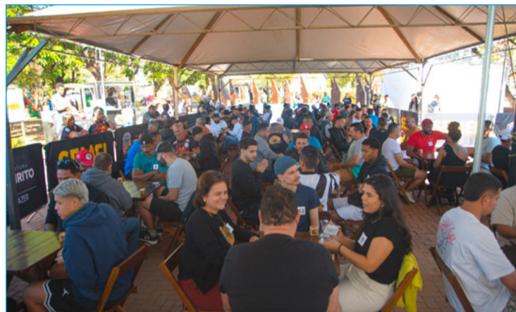
Torneio de truco em 2025

Promovido pela Secretaria de Esporte e Lazer de Itabirito, o torneio mantém o formato em duplas e deve seguir regras semelhantes às da edição anterior. O regulamento