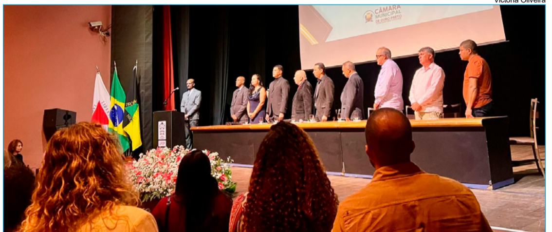
Cerimônia anual aconteceu na segunda(27)