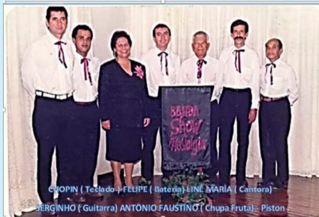
Recordando: Nossos bailes, nossa música.

Para refletir: Antes de resolver a vida, resolva o dia.