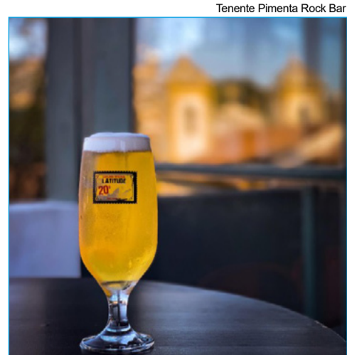
Tenente Pimenta Rock Bar

Os rótulos premiados são produzidos em Ouro Preto e reforçam a presença do município no cenário cervejeiro nacional e internacional. Nas redes sociais, a Prefeitura celebrou o resultado e destacou a importância da conquista. "Esse reconhecimento mostra a força do empreendedorismo local e como Ouro Preto segue levando seu nome para o cenário nacional e internacional", publicou. A própria cervejaria também comemorou o desempenho. "Voltamos com conquistas que reforçam aquilo em que sempre acreditamos: qualidade, processo e paixão fazem toda a diferença", afirmou em publicação.