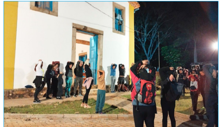
Caminhada noturna promovida em 2022

experiência que uma atividade física, paisagens naturais e convivência entre os participantes