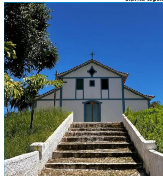
Capela de Nossa Senhora da Glória, em Barro Branco