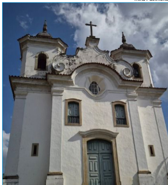
Igreja Matriz de Nossa Senhora do Rosário, em Padre Viegas