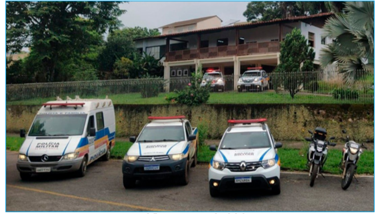
Viaturas em Itabirito