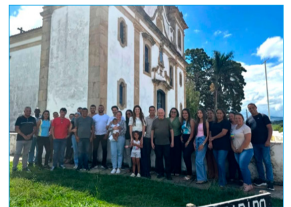
Visita a Glaura