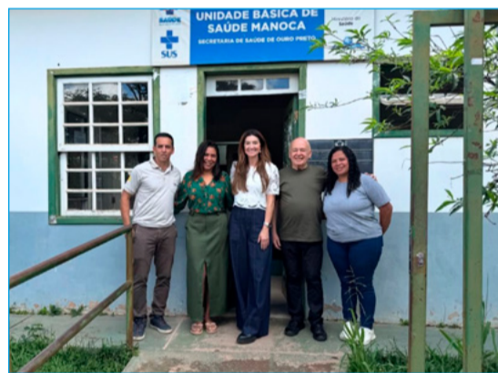
Visita a UBS em Santo Antônio do Leite

Já em Santo Antônio do Leite, a Unidade Básica de Saúde (UBS) Manoca deve passar por melhorias e ampliação. A proposta é fortalecer a estrutura de atendimento, oferecendo mais qualidade tanto para os pacientes quanto para os profissionais que atuam no local. A iniciativa conta