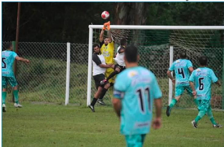
Independente e Glaura na disputa de bola