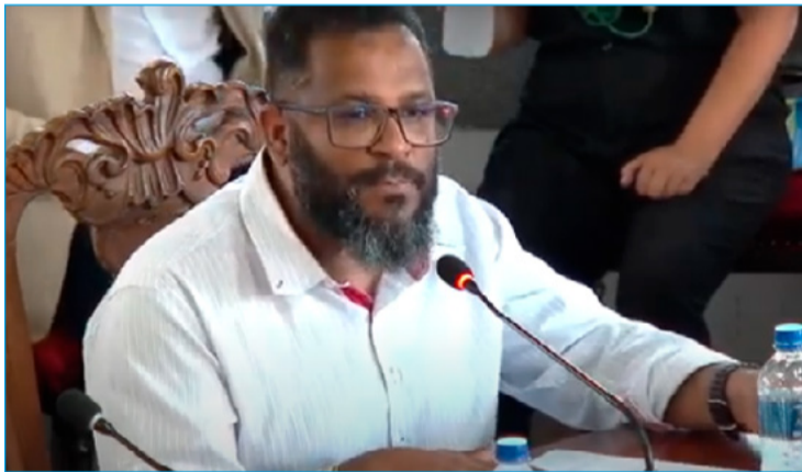
A criação do CER em Mariana foi pauta recorrente em campanhas políticas das últimas eleições