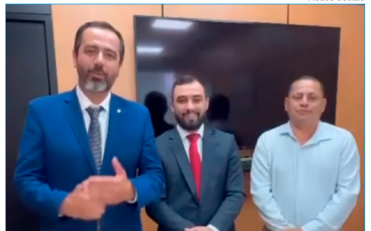
A expectativa é que até junho Mariana já receba a TV Câmara no município