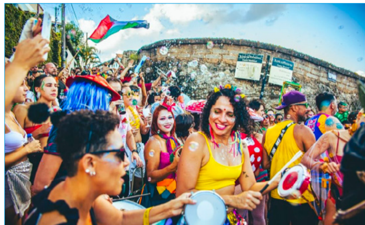
Bloco Unidos da Boa Viagem pelas ruas de Itabirito

No dia 15 de fevereiro, a programação do pré-carnaval continua, desta vez na sede, na Praça da Estação. A programação inclui a