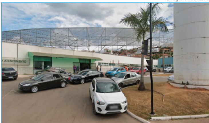
O atendimento da policlínica agora é feito no Complexo Integrado de Saúde na Rodovia dos Inconfidentes

viduais, o impacto da deficiência na funcionalidade e os fatores clínicos, emocionais, ambientais e sociais envolvidos.