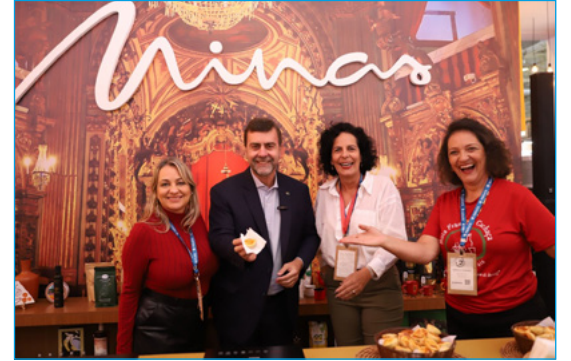
Presidente da Embratur, Marcelo Freixo, experimenta empadinha de Cachoeira da Prata, uma das iguarias da Rota do Frango e Cachaça

"Oh Minas Gerais, quem te conhece não esquece jamais", o verso que canta as riquezas e belezas das terras mineiras, dá o tom da participação de Minas Gerais na 36ª Festuris, em Gramado (RS), que trouxe ao público um pedaço autêntico da cultura e do turismo mineiro. Nos dias 8 e 9 de novembro, o estado esteve presente na mais efetiva feira de negócios turísticos das Américas, promovendo suas tradições, gastronomia e encantos naturais. De Belo Horizonte às históricas ruas de Ouro Preto a Cordilheira do Espinhaço, Minas apresentou aos visitantes as potencialidades que tornam a região um dos destinos mais desejados para turismo, evidenciando a diversidade e a hospitalidade mineira que são reconhecidas em todo o Brasil.