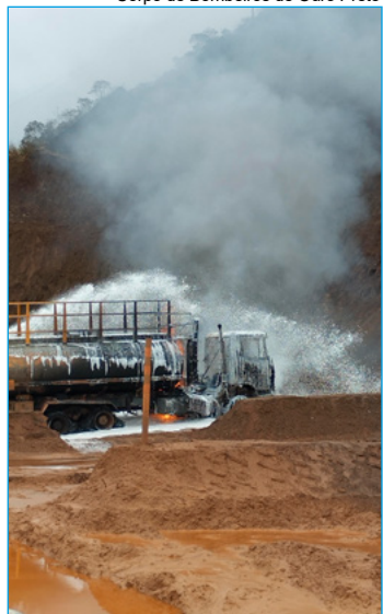
Corpo de Bombeiros de Ouro Preto