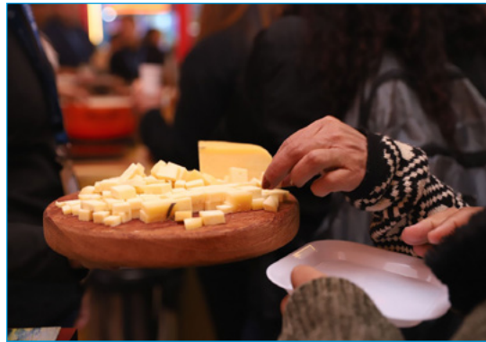
Rotas do Queijo do Serro e da Canastra são destaque durante Festuris