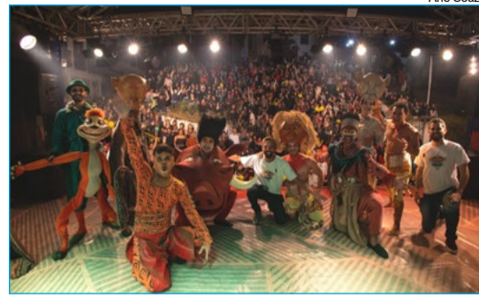
Espectáculo “O Rei Leão” encanta crianças e adultos em palco montado em frente à igreja de Nossa Senhora do Carmo

O Festival de Popularização do Teatro de Ouro Preto é um projeto idealizado e realizado pela Enquanto Isso em Ouro Preto, com patrocínio master do Instituto Cultural Vale, por meio da Lei Federal de Incentivo à Cultura (Lei Rouanet) do Governo Federal, e apoio da Prefeitura de Ouro Preto, com produção e comunicação da Holofote Cultural.