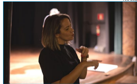
No intuito de promover maior acessibilidade, 3ª edição do Festival POP contou com intérprete de libras

Encerrando o Festival de Popularização, o espetáculo Hermanoteu na Terra de Godah, da Cia. Melhores do Mundo, traz Ouro Preto para seu texto e arranca risadas do público.