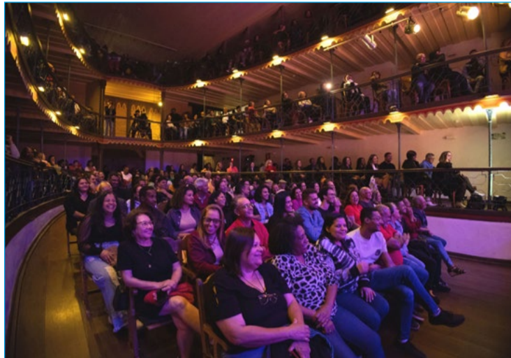
Público acompanha apresentação na Casa da Ópera