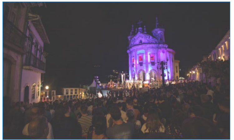
Milhares de pessoas acompanham a celebração da cerimônia do descendo da cruz, na Sexta-feira da Paixão