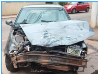
Frente do veículo ficou completamente destruída após a colisão

Ainda não há informações sobre dinâmica do acidente, velocidade dos veículos no momento da batida, mas câmeras de segurança no local podem ajudar a esclarecer o acidente.