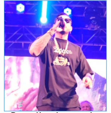
Rapper Hungria marcando a noite de sábado, em Itabirito