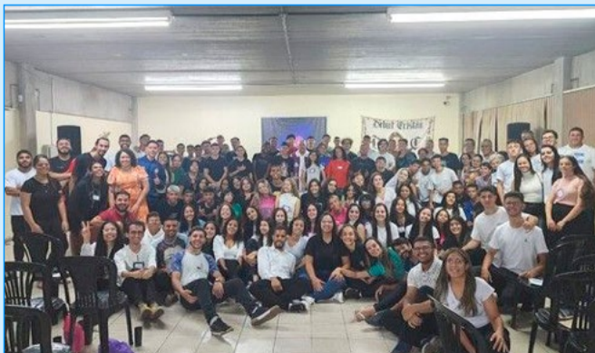
PPP. Parada pra pensar. Destaque em nossa região.

Para refletir: Ser bom é fácil, difícil é ser justo.