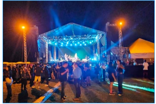
Grande palco foi montado pela organização do evento para receber todas as atrações da noite

O público esteve presente aguardando o rapper, que por volta das duas horas da manhã, subiu ao palco. Hungria ficou conhecido com o primeiro single "Bens materiais" e hoje conta com hits com mais de 300 milhões de visualizações nas plataformas digitais.