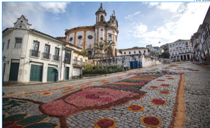
Tapete com releitura homenageia a multiartista Yara Tupynambá, um dos grandes nomes da arte mineira