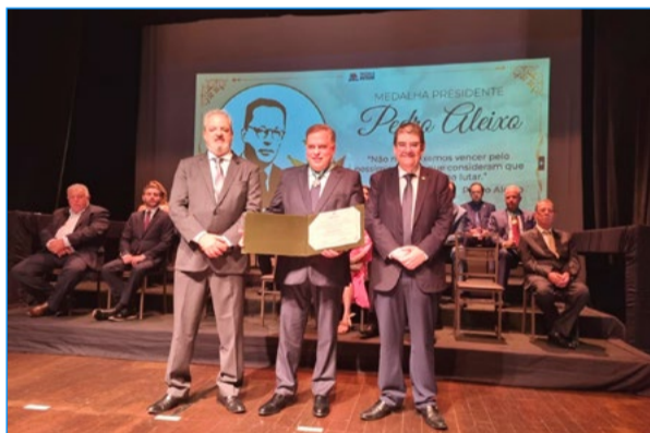
O deputado federal Paulo Abi-Akel