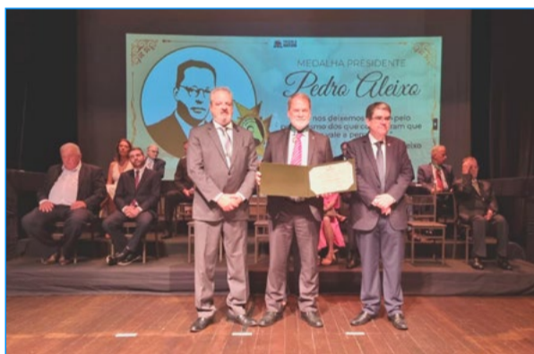
O Vice-presidente do Tribunal de Contas Durval Angelo