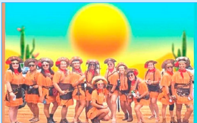
Bloco carnavalesco as cangaceiras

Para refletir: Nós acreditamos: que a fraternidade dos homens transcende a soberania das nações.