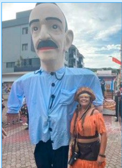
Boneco em homenagem a Notas da Pedra e a cangaceira