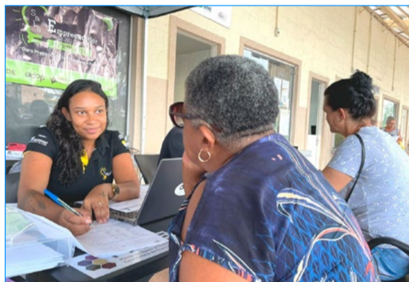
Sala do Empreendedor em Cachoeira do Campo

A Sala Mineira do Empreendedor trabalha para melhorar e simplificar o ambiente de negócios, oferecendo apoio para empreendimentos de todos os portes. Com atendimento personalizado, é possível formalizar o empreendimento, obter orientações, informações e conhecimento necessário para o desenvolvimento profissional do empreendedor. Na sede de Ouro Preto, o espaço fixo da Sala do Empreendedor está localizado na Rua do Pilar, nº 93a.