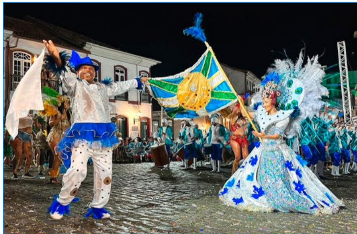
Império do Morro Santana vai do barroco ao rococó e realiza viagem de Vila Rica a Ouro Preto