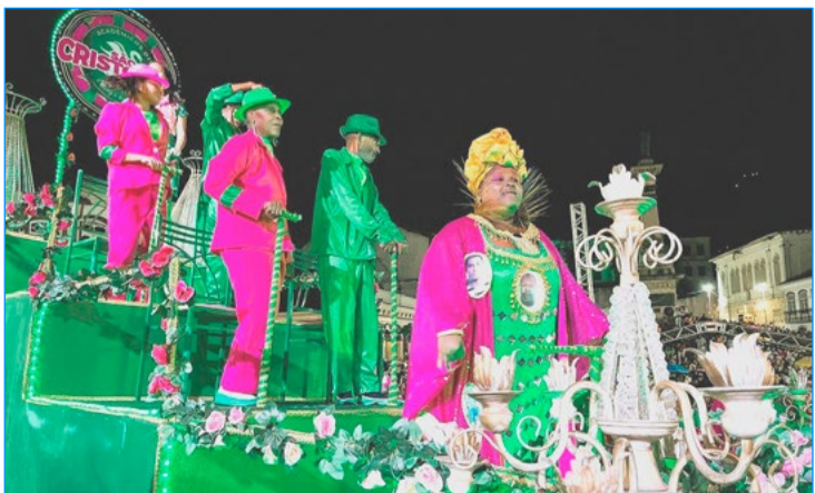
Com enredo “Quero ser tambor”, a verde e rosa ouro-pretana exalta a congada

local pela Justiça Federal. De acordo com o secretário de Cultura e Turismo de Ouro Preto, Flávio Malta, foi garantido o direito das comunidades ouro-pretanas. “O carnaval de Minas Gerais nasce na Praça Tiradentes. O direito de as escolas de samba desfilarem na praça é o direito da resistência da cultura. As escolas de samba de Ouro Preto possuem qualidade, são incríveis e impecáveis. Sambas muito bem escritos, baterias impecáveis. A gente só tende a valorizar e agradecer por ter essa cultura mantida”, completou Malta.