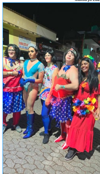
Foliões curtindo o desfile do tradicional Gaiola das Loucas

"Fiquei com um pé atrás por ser uma mulher trans. Normalmente, quem desfila na gaiola das loucas é uma drag Queen, e tem