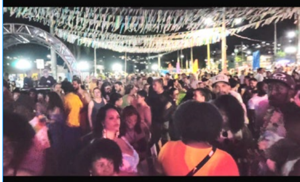
Fundo de Quintal atrai multidão para o palco da Praça da Estação

AUTO TECNICA VILELA LTDA , por determinação da Secretaria Municipal de Meio Ambiente e Desenvolvimento Sustentável e/ou Conselho Municipal de Desenvolvimento Sustentável e Melhoria do Meio Ambiente - CODEMA torna público que solicitou através do Processo nº 554/2023 - RENOVAÇÃO DA LAS para a atividade de SERVIÇOS E REPARAÇÃO MECANICA DE VEICULOS AUTOMOTORES. "