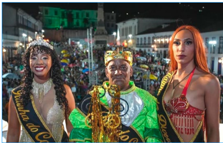
Corte Momesca abre desfiles da escola de Ouro Preto