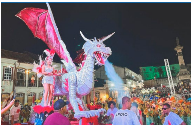
A Furiosa chega com seu imponente dragão na Praça Tiradentes