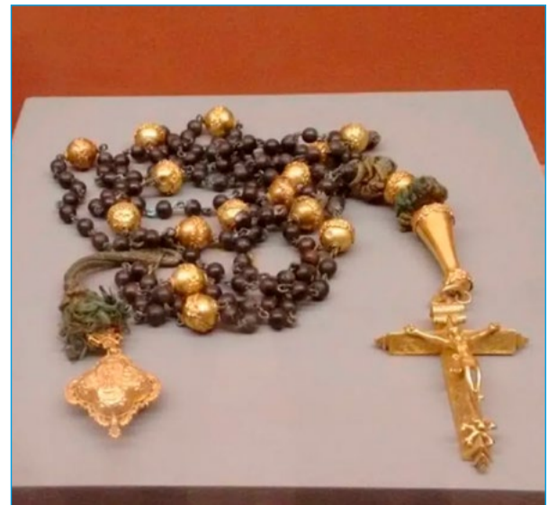
Basílica de Nossa Senhora do Pilar