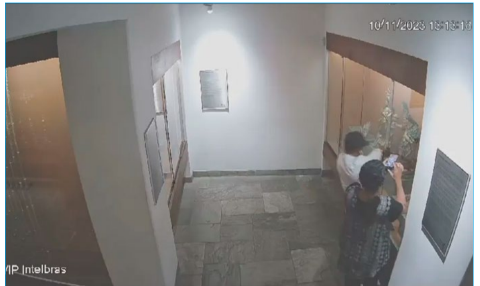
Circuito de segurança

foi presa no dia 17 de novembro, em São Paulo, durante a Operação Relicário, lançada pelo MPMG para