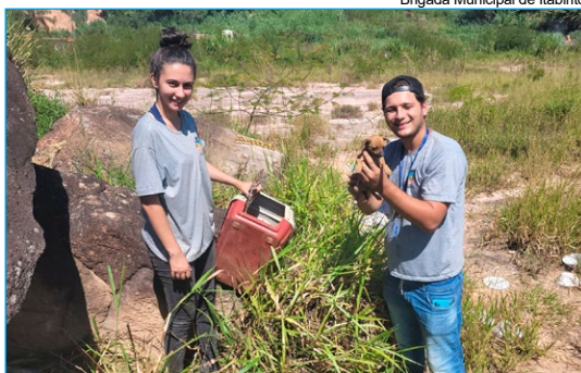
Brigada Municipal de Itabirito