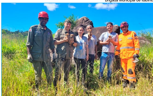
Brigada Municipal de Itabirito

A Brigada não informou como os animais chegaram ao local. Mas, vale ressaltar que maus-tratos ou abandono de animais é considerado crime ambiental e pode resultar na pena de três meses a um ano de prisão e pagamento de multa.