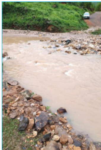
Santo Antônio do Salto

Até a data (terça-feira) não havia o número de residências que foram atingidas. A Defesa Civil