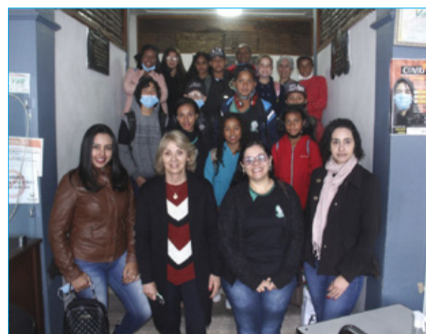
ainda relata que a visita contribuiu muito para que os alunos pudessem consolidar a teoria e prática.