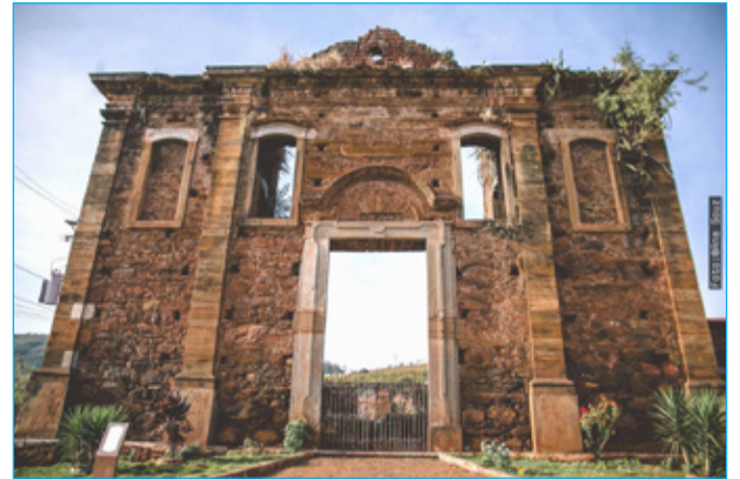
Igreja Queimada do distrito Antônio Pereira, um dos bens patrimoniais que passará por restauração

• Reforma da Casa de Pedra de Amarantina; • Descupinização e reforma do telhado da Capela do Fundão do Cintra; • Resgate dos elementos artísticos e integrados do Casarão Baeta Neves.