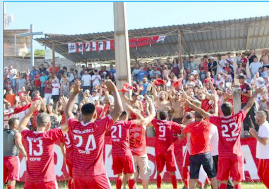
Santa Luzia: Fundado em 1999, a equipe de futebol Santa Luzia de Cachoeira do Campo sagrou-se bicampeã da cidade. Campeonato esse que contou com diversas equipes de Ouro Preto e distritos. A torcida pele vermelha lotou o estádio, além de propiciar uma bonita festa em toda Cachoeira do Campo. Parabéns!