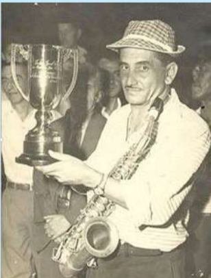
Arquivo Ivacy Simões

Para Refletir: Não tenho tempo para mais nada, ser feliz me consome muito. (Clarice Lispector)