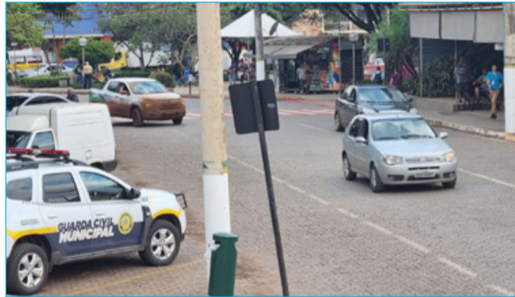
Trânsito na tarde de 05/05 na área central de Itabirito

Tais números são somente partes das perdas e danos causados pelo trânsito.