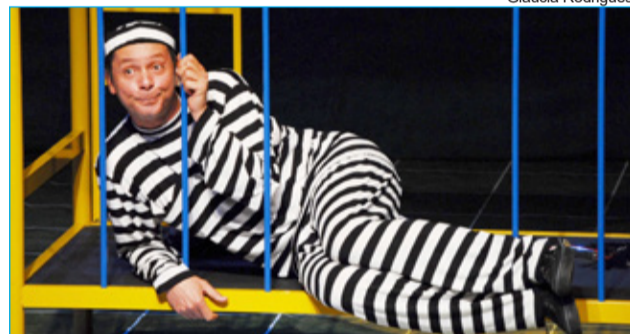
Espectáculos “Comi uma galinha” e “Tô pagando o pato”

O Festival de Popularização do Teatro de Ouro Preto divulgou na última segunda-feira (18), a lista de espetáculos selecionados para a segunda edição do Festival, que será realizado entre os dias 27 e 29 de maio. Foram selecionadas seis propostas para apresentações e seis propostas ficaram como suplentes. A programação completa com as datas e horários das peças vai ser divulgada no site do evento.