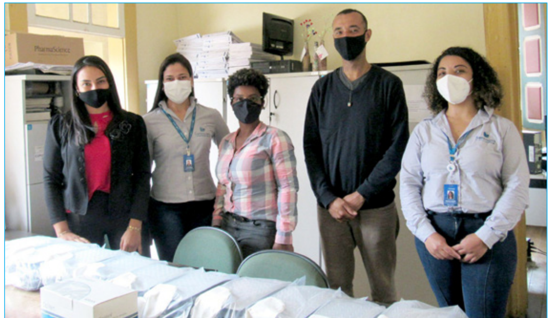
Equipe da Saneouro entregando os reagentes à Secretaria de Meio Ambiente

O projeto é uma realização da Universidade Federal de Ouro Preto em parceria com a Secretaria Municipal de Meio Ambiente e com o apoio da SANEOURO.