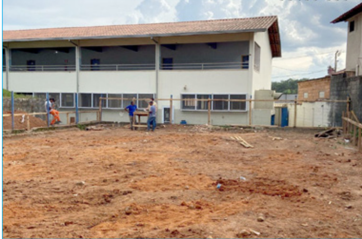
A expectativa é de que as obras sejam concluídas no segundo semestre deste ano. Atualmente, a obra está na fase de fundação.