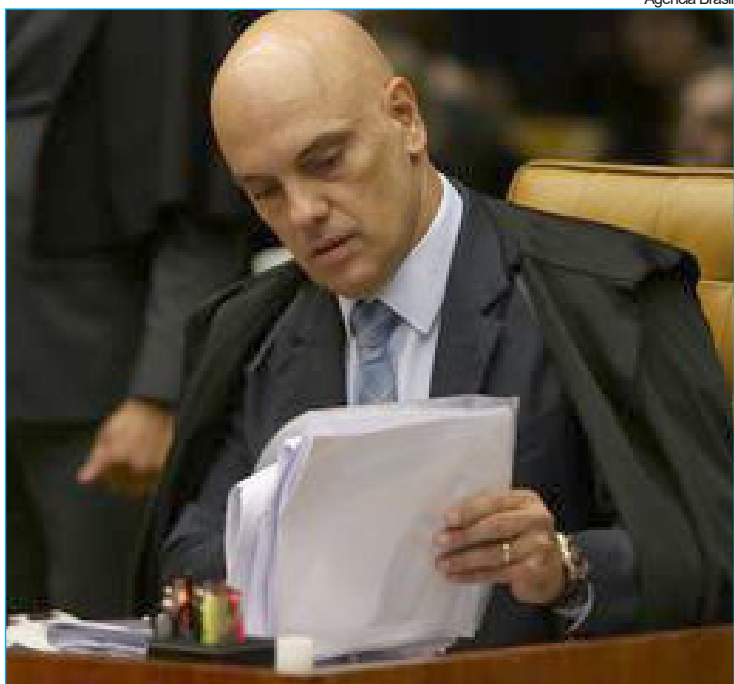
Ministro Alexandre de Moraes