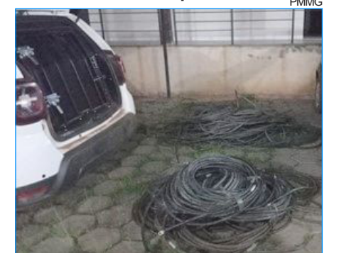
Fios de cobre apreendidos