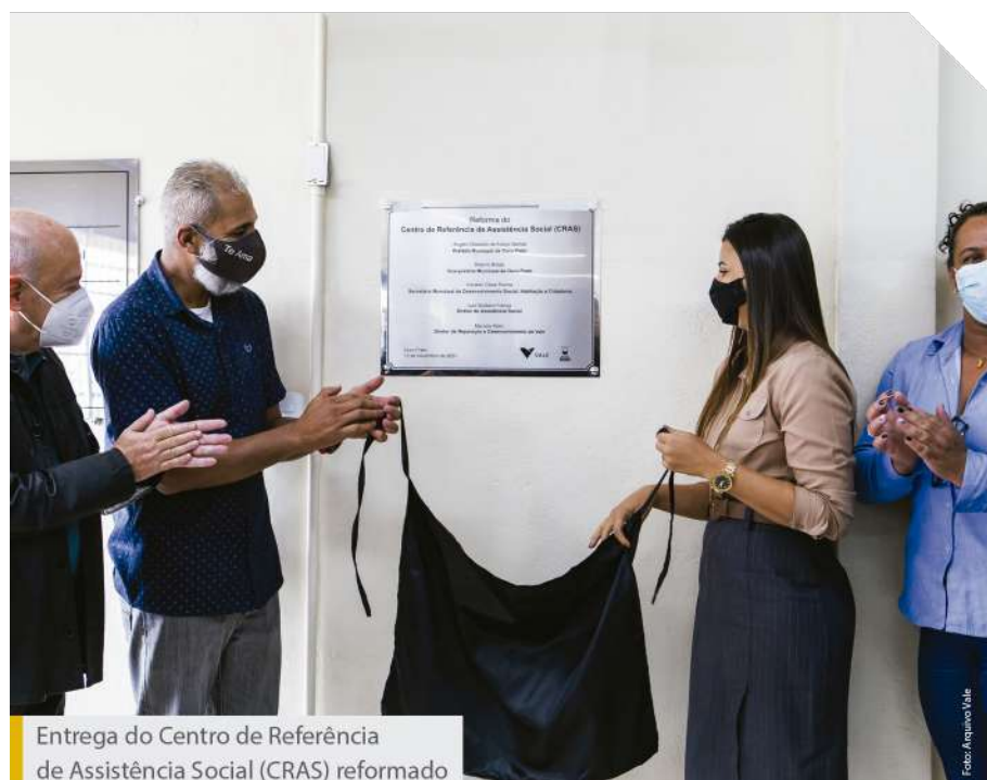
Entrega do Centro de Referência de Assistência Social (CRAS) reformado

Mais de 840 famílias em situação de vulnerabilidade foram beneficiadas com a reforma do Centro de Referência e Assistência Social (CRAS), idealizada para garantir mais segurança e conforto no atendimento.