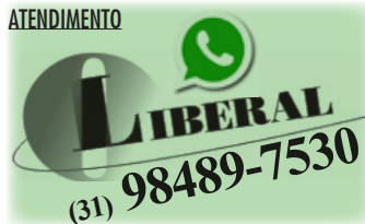
Wesley de Souza