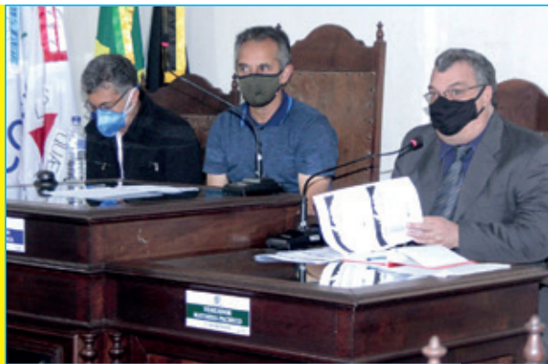
Prestação de contas do Legislativo de Ouro Preto

realizadas no CEMPA - Centro de Educação Municipal Padre Avelar, nas CMEI's Santa Rita de Cássia, Casinha Nazaré, Cuidar e Educar, Danielle Cristina Mendes da Silva, Santo Antônio, Tia Elza, escolas municipais Aníbal de Freitas, Bento Rodrigues, Cônego Paulo Dilásio, Dante Luiz dos Santos, Barro Branco, Campinas, Furquim, Mainart, Dom Luciano Pedro Mendes de Almeida, Geraldo Timóteo, Joaquim Emilio Baptista, Padre Antônio Gabriel de Carvalho, Padre Viegas, Paracatu de Baixo, Passagem de Mariana, Prefeito Jadir Macedo, Professora Celina Célia Gomes, Santa Godoy, Serra do Carmo, Sinhô Machado e Wilson Pimenta Ferreira.