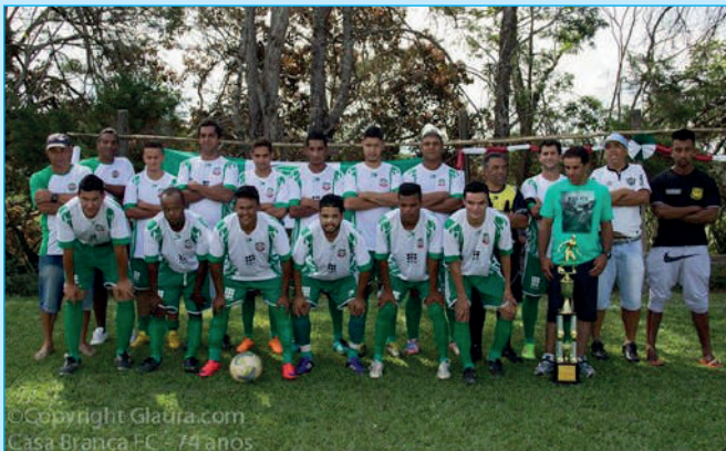
Vida: Time do Casa Branca F. C. 74 anos de glória e muitas conquistas