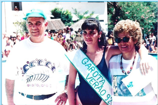
Desfile: Na década de 90, garota verão no União Sport Club, reunindo gente bonita e afinada com nossos eventos

Para Refletir: Lembra-te em matéria de atitudes a vida não fornece cópias para revisão. (Chico Xavier)