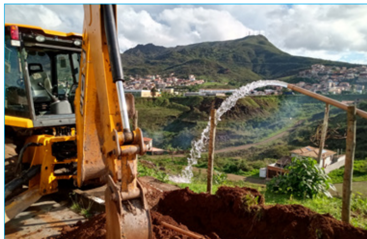
Intervenção ampliou o abastecimento para os moradores da Rua Arthur Versiani Machado

A equipe técnica iniciou na terça-feira (17) na Rua Arthur Versiani Machado, o remanejamento de aproximadamente 200 metros da rede de água, ampliando o diâmetro do encanamento de 25 para 60 mm. "É uma obra emergencial, mas muito significativa, pois vai chegar mais água, com mais pressão nas caixas d'água. Essa é uma das ruas do bairro que mais sofrem com a irregularidade do abastecimento, pois a rede é inadequada e a maioria dos imóveis são prédios com até cinco andares, o que dificulta a chegada da água nos reservatórios", explica o supervisor de manutenção de redes da Saneouro,